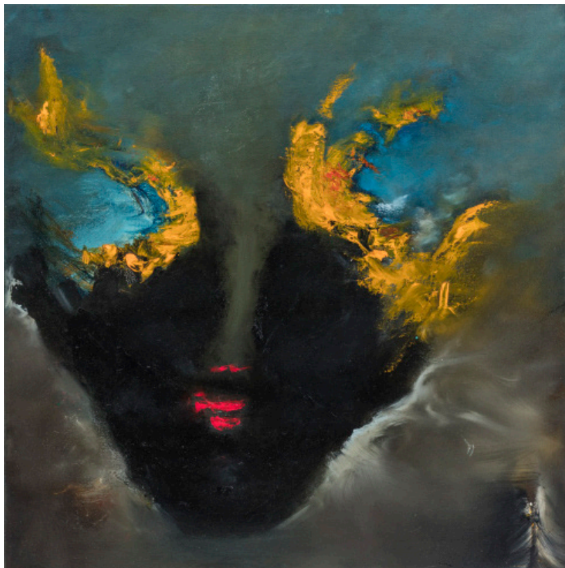
Figure 1 : Le rêve du Masque, 2015, p. 24.

La plupart des images aux couleurs intenses sont des reproductions de toiles non figuratives, sinon à la limite de l'abstraction. Rarement, une figure se glisse discrètement dans le champ des couleurs, davantage suggestion qu'illustration ( Tsunami , 2015, p. 12 ; Dans la tourmente , 2016, p. 80 ; Le rêve du Masque , 2015, p. 24, figure 1).