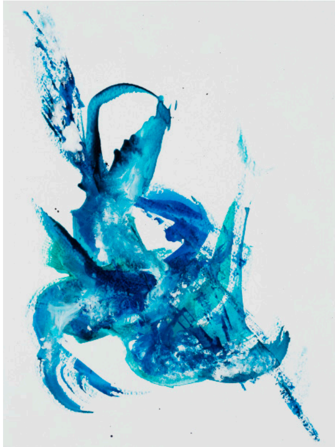
Figure 4 : Le printemps... bientôt, 2016, p. 16.

Ici, une arabesque en bleu et ses lignes dansantes ; la grâce des glissandi de couleur rappelle la calligraphie japonaise.