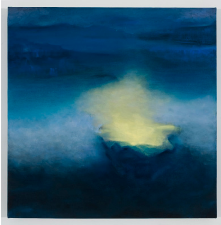
Figure 2 : Éveil , 2010, p. 52 ; tableau associé au solo de cor anglais de Tristan et Isolde (1858) de Richard Wagner.

Dans les profondeurs du champ de bleu marine jaillit une lumière irréaliste, éclatant dans l'ombre dense. L'horizon semble sans limites et le regard dépasse le cadre visible de la toile. Le spectateur a l'impression de se perdre dans l'immensité de l'océan.