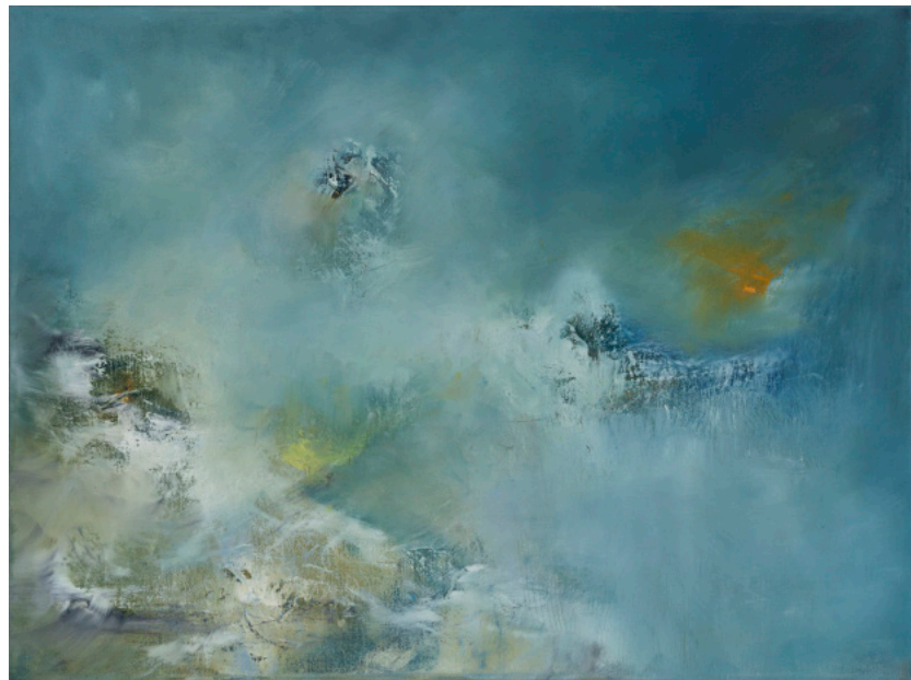
Figure 3 : Embrumée , 2014, p. 34-35 ; tableau associé à In un silenzio ordinato (1985) de Ada Gentile.

Dans les profondeurs du champ de bleu marine jaillit une lumière irréaliste, éclatant dans l'ombre dense. L'horizon semble sans limites et le regard dépasse le cadre visible de la toile. Le spectateur a l'impression de se perdre dans l'immensité de l'océan.