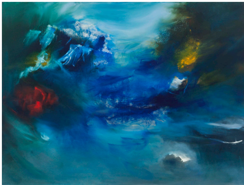
Figure 5 : Lame de fond, 2015, p. 8.

Ici, une arabesque en bleu et ses lignes dansantes ; la grâce des glissandi de couleur rappelle la calligraphie japonaise.