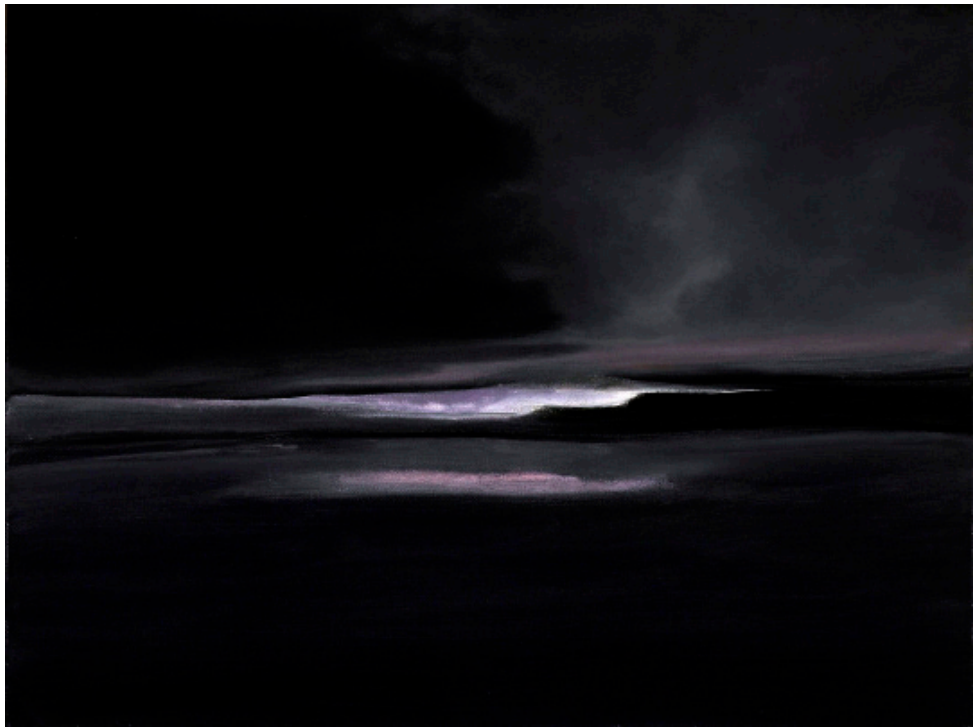
Figure 6 : Promesse d'infini, 2008, p. 54 ; tableau associé à La cathédrale engloutie (1910), prélude pour piano de Claude Debussy.

entre les nuances de bleu du fond et les invasions du noir, au cœur d'une scène imaginaire en trois dimensions.