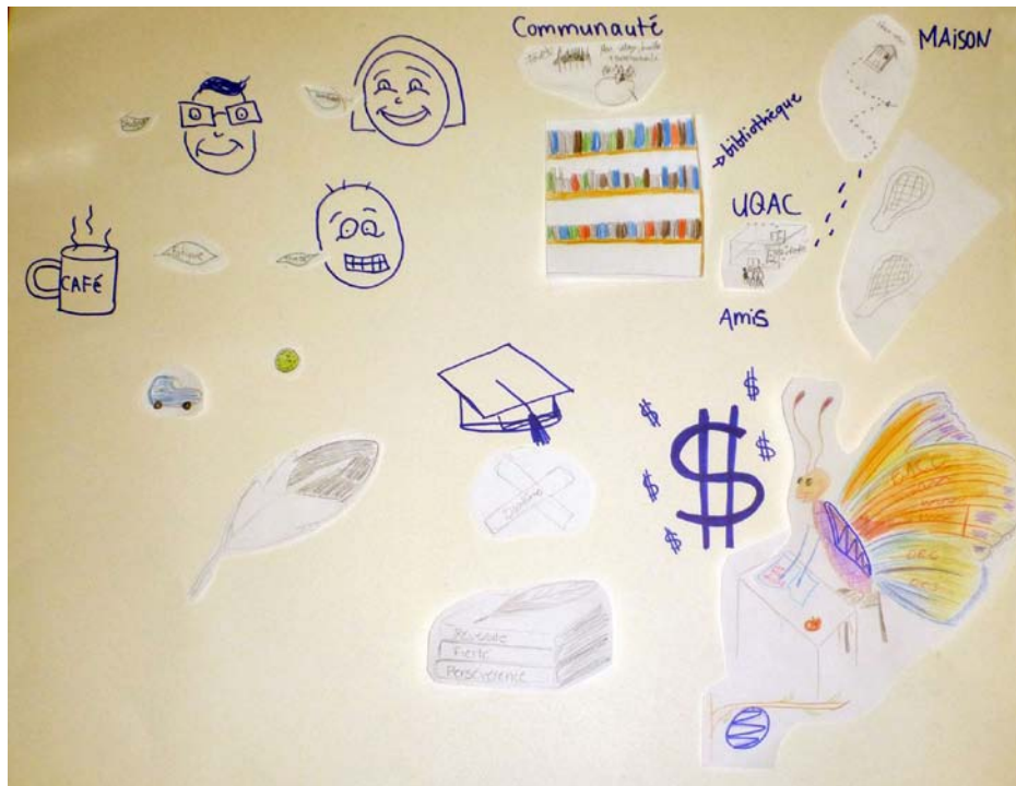
Figure 4. Le dessin collectif : regroupement des éléments choisis par les répondants qui témoignent du sens de leur expérience scolaire à l'Université (Joncas, 2013, p. 97).

conséquent, la mutuelle influence, la coopération et la discussion entre les participants autour de la construction consensuelle du dessin collectif mènent à une coconstruction de l'analyse du sens de l'objet de l'étude. Ce processus négocié de mise en forme soumet les participants à une démarche réflexive comportant des sélections et des hiérarchisations d'éléments plus pertinents que d'autres. Par leur choix consensuel, les éléments figurant sur le dessin collectif sont ainsi liés à chaque participant. Par exemple, la plume figurant sur la Figure 4 du dessin-entretien collectif des étudiants universitaires des Premières Nations a été choisie à l'unanimité par tout le groupe pour figurer sur le dessin collectif.