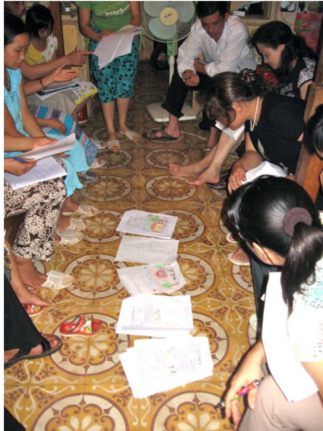
Figure 3. Présentation individuelle et première thématisation (Lavoie, 2008).

compte des éléments de sa subjectivité en essayant d'en diminuer les effets sur la recherche en n'orientant pas le choix des éléments du dessin collectif. Dans ce moment de construction consensuel, un dessin rejoignant l'expérience de tous les participants prend forme. Selon l'expérience des chercheuses, il est peu probable que le groupe choisisse un seul dessin individuel. Par contre, les membres du groupe peuvent choisir des idées des différents participants en découpant les éléments des dessins individuels qui regroupent les idées de plusieurs participants et en les collant sur un grand carton (voir la Figure 4). Le chercheur rappelle que les éléments choisis doivent rejoindre tout le groupe formant ainsi un dessin collectif. En plus des éléments découpés, de nouveaux éléments peuvent être dessinés sur le dessin collectif afin de le compléter. Par