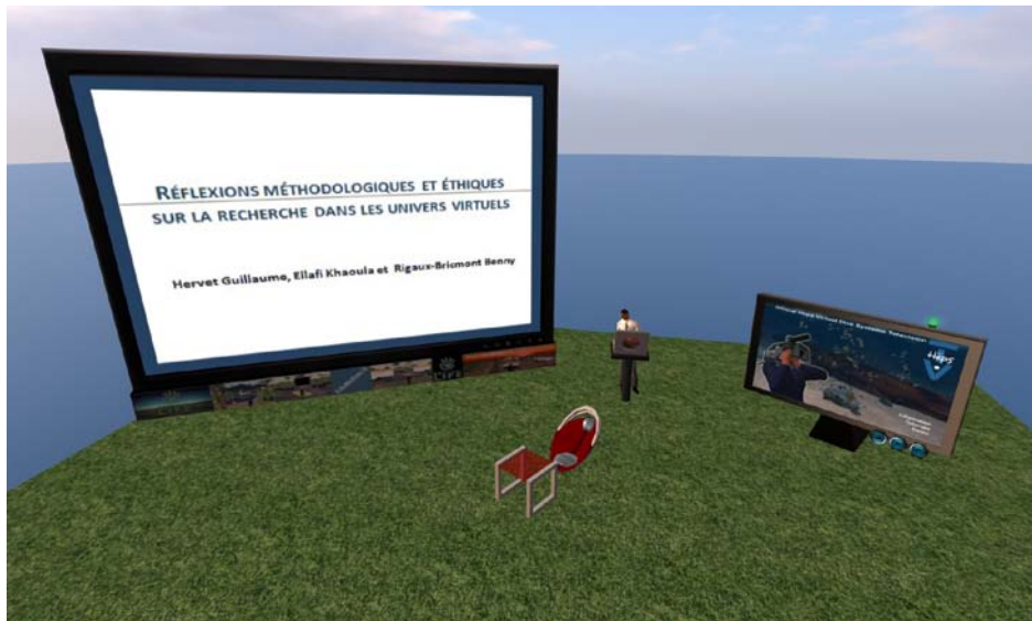
Figure 5 : Présentation de diapositives PowerPoint et télévision virtuelle auprès des participants, (4) l'accueil des participants, (5) l'animation de l'entretien de groupe et (6) la sauvegarde des données. Chacune de ces six étapes est présentée plus en détails.