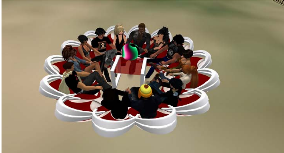
Figure 7 : L'entretien de groupe (12 participants et 2 chercheurs)

invités à faire part de leur consentement par le biais de l'objet prévu à cet effet (Figure 3). Le consentement portait sur l'enregistrement du texte de l'entretien de groupe (par la suite, les participants consentiront à ce que des photographies soient prises, mais il n'y aura pas unanimité pour dévoiler le nom des avatars présents). Après avoir introduit le second chercheur au groupe, le chercheur principal a répondu à quelques questions de clarification. Par ailleurs, le rôle du second chercheur a été précisé. Les participants pouvaient communiquer avec ce dernier s'ils souhaitent aborder un sujet sans pour autant que le reste du groupe sache qui proposait le sujet. Enfin, les chercheurs ont proposé un premier tour de table marquant le début de l'entretien.