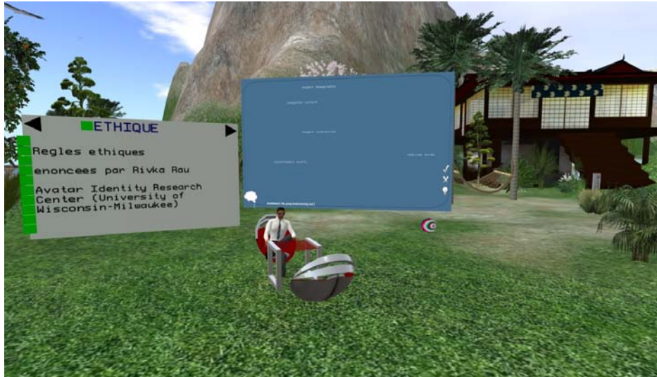
Figure 2 : Outils utiles pour un entretien de groupe dans Second Life