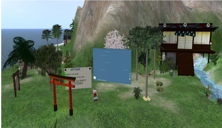
Figure 1 : Exemple de site pour un entretien de groupe dans Second Life

car on y trouve beaucoup de prims libres pour y charger le matériel virtuel nécessaire, on peut y rassembler aisément les participants – soit par une invitation à se téléporter sur le lieu, soit par remise d’un repère terrain ( landmark ) – et, enfin, car le trafic y est modéré.