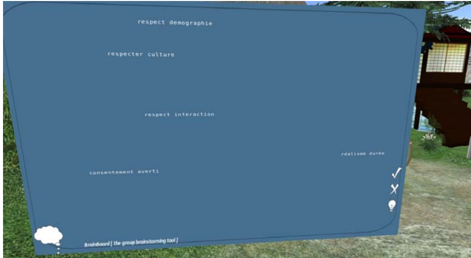
Figure 4 : Lancer des idées de façon anonyme sur le tableau « remue-méninges »