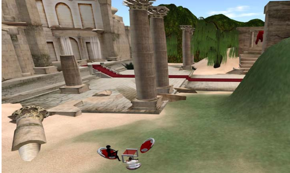
Figure 6 : Préparation de la rencontre

cadre de sa recherche, le chercheur souhaitait interroger des participants francophones, et donc localisés majoritairement en Europe, ce qui demandait un horaire adapté pour deux zones géographiques (Europe et Est de l'Amérique du Nord). Par ailleurs, il est possible d'utiliser l'heure PDT, heure officielle de Second Life (fuseau horaire de l'état de Californie aux États-Unis), mais nombreux sont les résidents qui restent confus avec cette référence. En plus de la convocation, un rappel leur a été envoyé la veille de l'entretien de groupe.