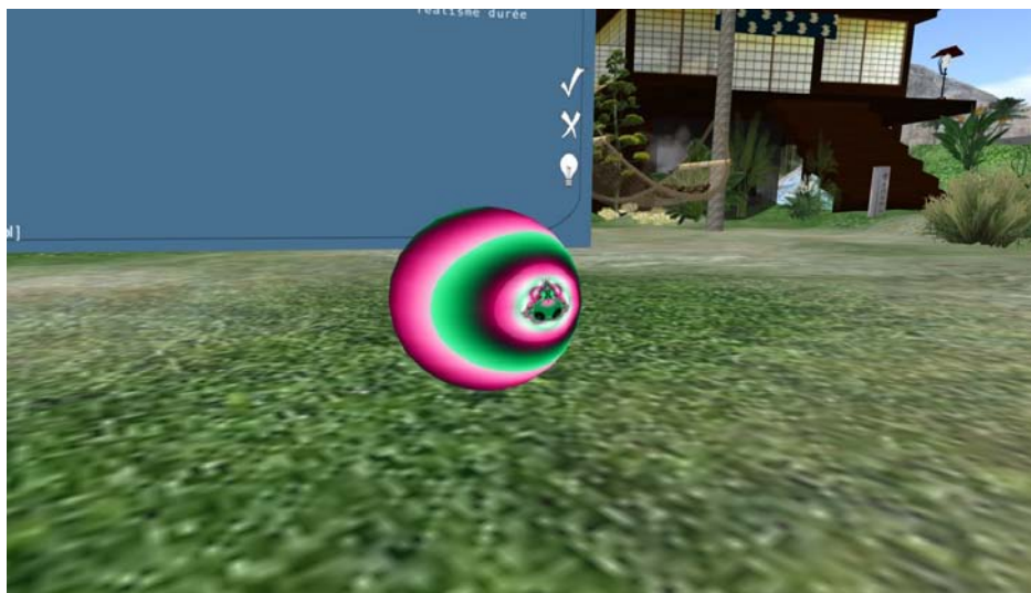
Figure 3 : Boule de consentement pour l'enregistrement des échanges

dactylographie évite non seulement la transcription par écrit de l'enregistrement sonore (puisque, dans ce cas, un simple copier-coller suffira) mais elle permet aussi plus de discipline dans les échanges en donnant plus de