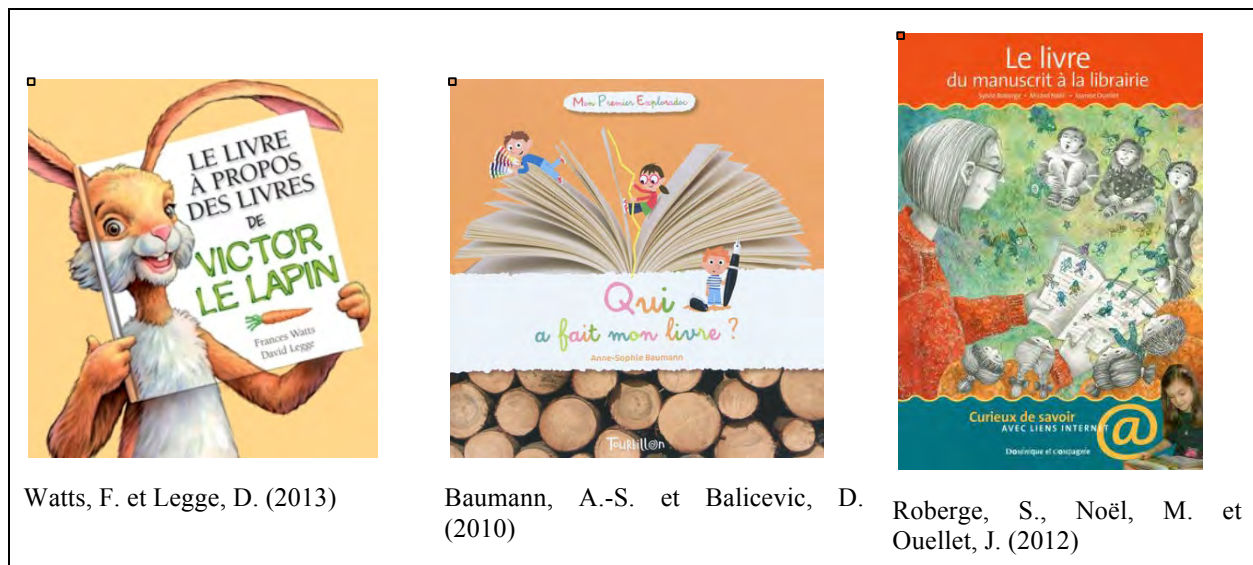
Tableau 11 - Exemples d'albums documentaires abordant le concept de livre

Une autre catégorie d'ouvrages documentaires peut également apporter une contribution notable au développement de connaissances sur l'écrit. Il s'agit des livres visant à décrire «l'objet» livre ou à en expliquer le processus de création (voir tableau 11). Par exemple, l'album Le livre à propos des livres de Victor le lapin (Watts et Legge, 2013) présenté dans le tableau 5 met en scène un lapin qui explique aux enfants qu'il existe une grande diversité de livres dont le type varie en fonction de leurs formes, des sujets qu'ils abordent et de leurs caractéristiques particulières. Les commentaires du personnage fournissent également de l'information sur différents concepts reliés au livre, tels que les notions d'auteur, de page de garde, de note de publication, etc.