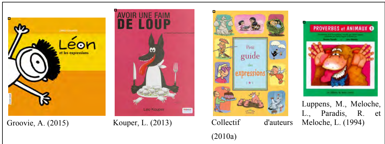
Tableau 7– Exemples d'albums documentaires permettant de réfléchir au sens des expressions et des proverbes

La compréhension des expressions et des proverbes demeure complexe pour les enfants qui accèdent difficilement au sens figuré qu'elles véhiculent. À cet égard, il peut être intéressant de recourir aux albums qui abordent ces expressions et proverbes sur un ton souvent humoristique, confrontant parfois le sens littéral au sens figuré, comme le fait le livre Léon et les expressions (Groovie, 2015). Le tableau 7 présente des exemples de volumes qui offrent des occasions riches et amusantes de réflexions et de discussions à propos de la signification d'expressions ou de proverbes dont le sens réel n'est généralement pas connu des enfants.