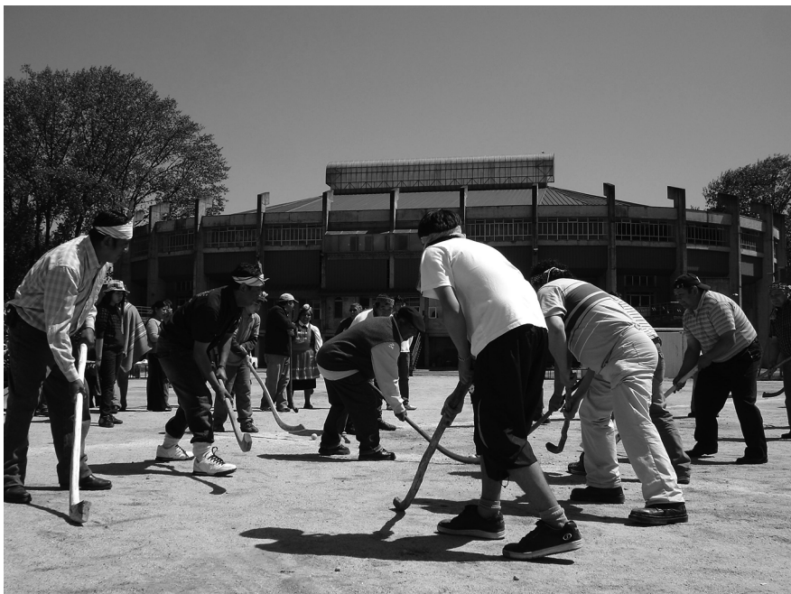
Figure 3 Tournoi de palin au stade régional de Concepción (Photo de B. Sepúlveda, octobre 2008)

Dans les mois qui suivirent, plusieurs réunions intercommunales eurent lieu, au cours desquelles les dirigeants de l'ensemble des associations discutèrent des modalités de mise en place d'un référent majeur et agglutinant. Sur proposition des membres de Newen Mapu, le lancement officiel de cette plateforme associative se ferait lors de la réalisation d'un grand nguillatun – cérémonie la plus importante du complexe rituel mapuche – qui aurait lieu dans la Réserve nationale Nonguén 5 dont la « récupération » constitua le propos mobilisateur du processus organisationnel. La date choisie, du 28 février au 1 er mars 2009,