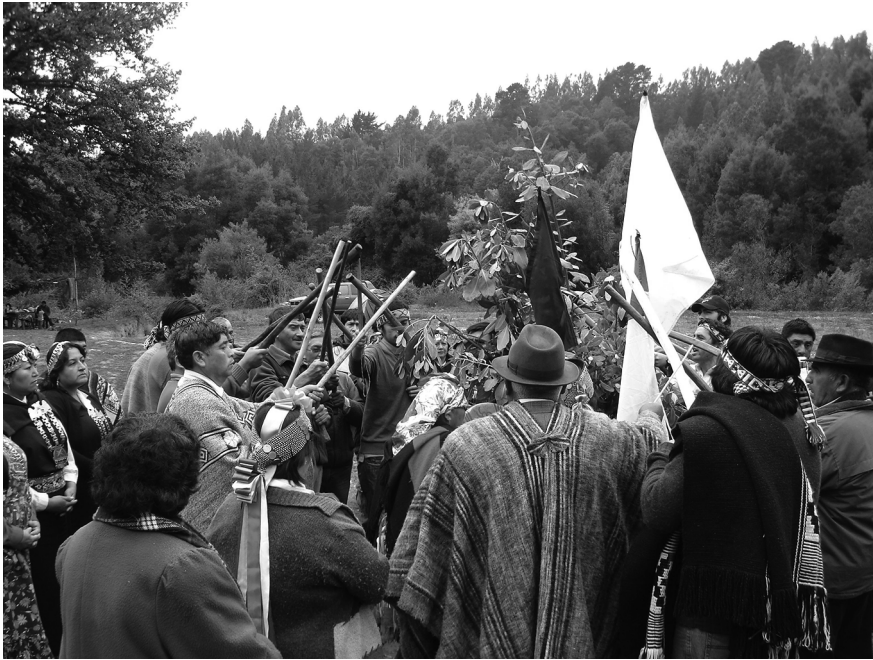
Figure 4 Participants au nguillatun de 2009 (Photo de B. Sepúlveda, février 2009)