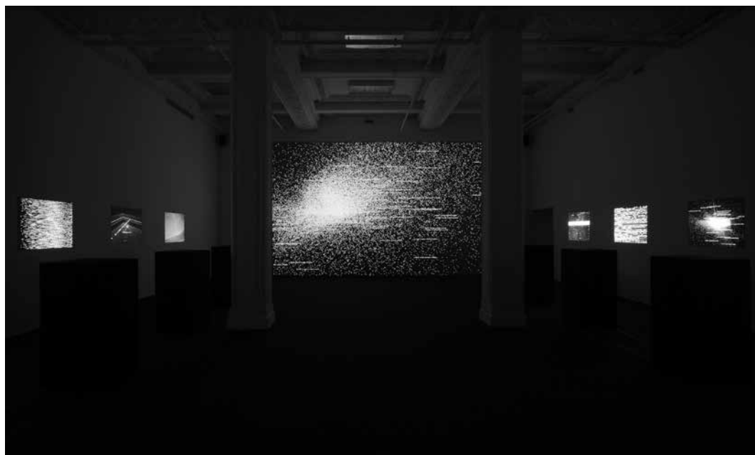
Figure 4. Projection du fond: Ryoji Ikeda (concept et composition) et Shohei Matsukawa, Tomonaga Tokuyama (infographie et programmation), data.tron [WUXGA version], 2011, projecteur DLP, ordinateur, hauts-parleurs, dimensions variables. Rangées de projections de chaque côté: Ryoji Ikeda (concept et composition) et Shohei Matsukawa, Norimichi Hirakawa, Tomonaga Tokuyama (infographie et programmation), data.matrix [n° 1–10], 2009, 10 projecteurs DLP, ordinateurs, hauts-parleurs, plinthes en bois, environ 270 × 60 × 80 cm. Montréal, DHC/ART, 14 juin–18 novembre 2012 (avec la permission de DHC/ART Fondation pour l'art contemporain; photo: Richard-Max Tremblay).

dispositif artistique. En testant les déterminants et les limites de la perception, elles proposent une réinterprétation du rapport de pouvoir qui fonde l'expérience de transcendance propre au sublime.