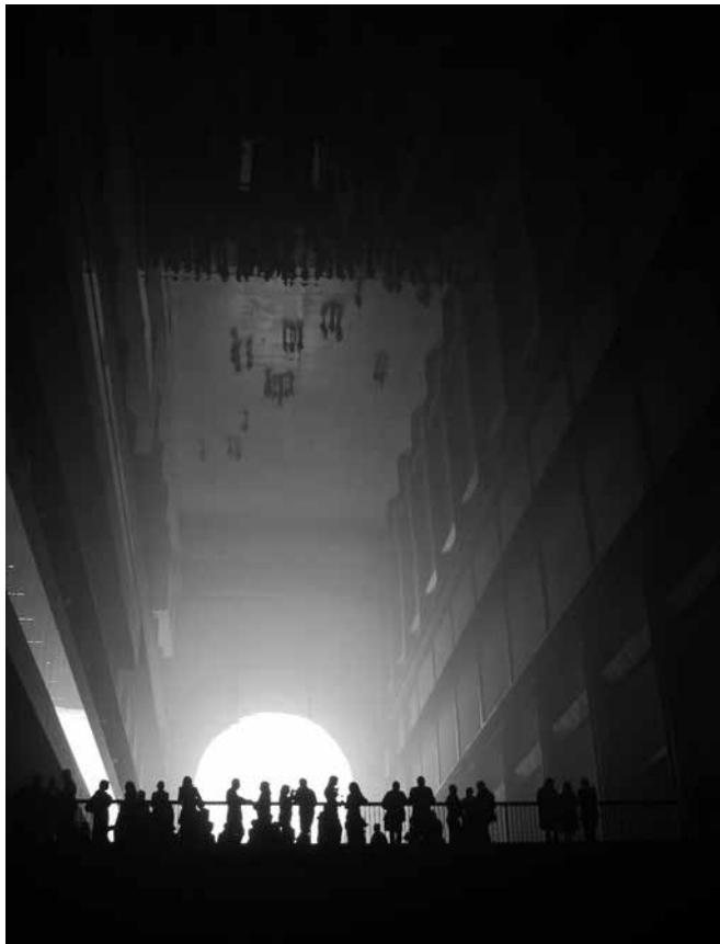
Figures 5. Olafur Eliasson, The weather project , 2003. Lampes mono-fréquence, feuilles de projection, machines à vapeur, feuilles miroirs, aluminium, échafaudages, 267 × 223 × 1554,4 cm. Tate Modern, Londres, 2003 (photo: Andrew Dunkley & Marcus Leith. Courtesy of the artist; neugerriemschneider, Berlin; and Tanya Bonakdar Gallery, New York. © Olafur Eliasson).

hauteur la distance qu'il perd en étendue lorsque le spectateur s'approche de la demi-sphère. Globalement, le dispositif mis en place par Eliasson distord ainsi les repères spatiotemporels qui organisent notre appréhension courante de l'espace naturel et humain.