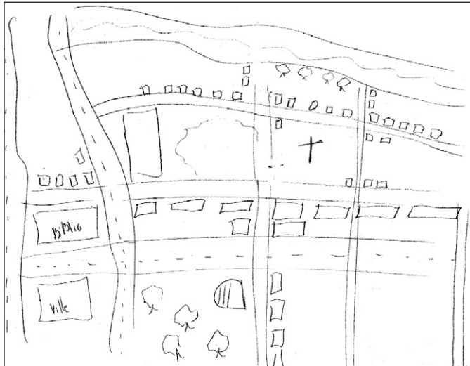
Carte 1. Le quartier Saint-Roch représenté par un CQ