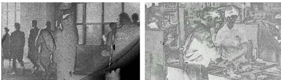
Figure 3 Photogrammes tirés du deuxième refrain, de 22 : 50 à 28 : 58, dans Miron .

Le refrain visuel est répété trois fois durant la projection du film tout en se transformant au fur et à mesure – d'où la variation dans la répétition – de la progression narrative et, à chaque fois, il présente deux, trois ou quatre leitmotive. La première fois (de 04 : 26 à 11 : 34), le refrain succède au prologue et se présente avec la voix hors champ de Miron citant le poème « La marche à l'amour ». Sa deuxième présence (de 22 : 50 à 28 : 58) est accompagnée des poèmes « L'amour et le militant », « La marche à l'amour » et « Le camarade », d'ailleurs transfigurée par un effet de surexposition. Enfin, les mêmes images (de 61 : 36 à 68 : 45) réapparaissent avec le poème « Compagnon des Amériques » et, cette fois, elles sont défigurées et embrasées jusqu'au noir total.