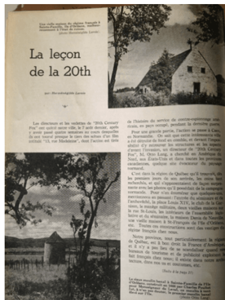
Figure 3 Article d'Herménégilde Lavoie, « La leçon de la 20 th Century Fox », dans La Belle Province .

Nous en avons pour preuve quand, avec un peu d'agencement, une compagnie de cinéma a trouvé possible de tourner ici la bonne moitié d'un film, en donnant l'illusion aux spectateurs que l'action se passait à Caen. Et je tiens de plusieurs personnes qui connaissent bien la Normandie que c'était ressemblant à s'y méprendre 24 .