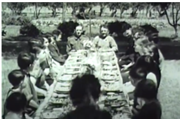
Figure 12 Sainte-Famille, île d'Orléans (Herménégilde Lavoie, vers 1940). Centre d'archives de Québec de BAnQ.

en famille, temps de prière. Il les montre au travail, visages souriants, heureux de fournir un effort qui sera couronné de succès.