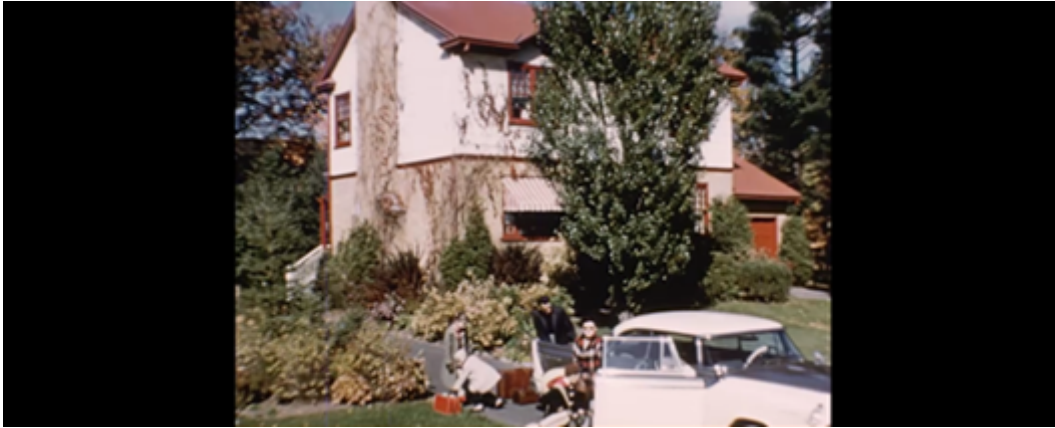
Figure 6 Une famille québécoise sur le point de partir en vacances. ( Stop , Herménégilde Lavoie, 1957).

vince – l’idée étant que, pour embellir la province, il faut aussi informer et éclairer ses habitants. Lavoie tente d’assumer cette visée éducative dans la plupart de films de commande comportant un aspect publicitaire sur lesquels il travaille. En 1955-1956, il réalise ainsi un film publicitaire et éducatif pour la maison Bouchard et Robitaille, une entreprise canadienne-française spécialisée dans l’isolation au moyen de matériaux comme la laine minérale, la fibre de verre, l’amiante – provenant des mines des Cantons-de-l’Est (Thetford, Asbestos) – ou encore le liège, qu’elle fait venir du Portugal. Le film, intitulé Confort et économie par l’isolation , vante l’expertise de l’entreprise pour le dixième anniversaire de sa fondation ainsi que la qualité des matériaux qu’elle utilise, comme la ouate minérale soufflée de l’entreprise Johns-Manville. Lavoie sait qu’il doit avant tout mettre en valeur les services de l’entreprise Bouchard et Robitaille, mais son ambition est plus grande pour ce film qui, selon lui,