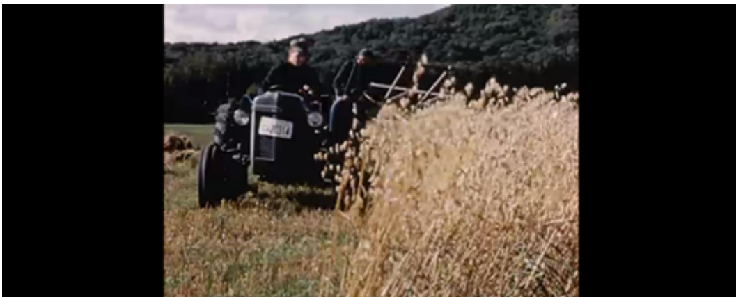
Figure 5 Agriculteurs au travail. ( Stop , Herménégilde Lavoie, 1957).

Un autre aspect important de la plupart des films de Lavoie est leur visée éducative, que l'on retrouve d'ailleurs dans la plupart des articles de La Belle Pro-