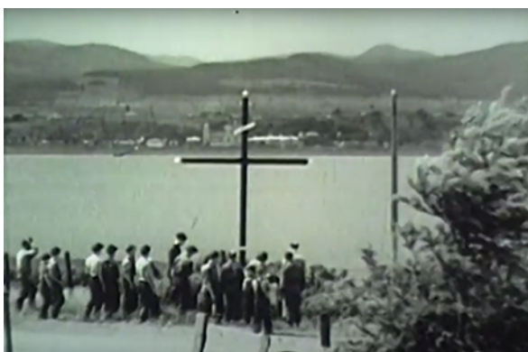
Figure 13 Sainte-Famille, île d'Orléans (Herménégilde Lavoie, vers 1940).

Si Lavoie offre un tableau charmant et peut-être idéalisé de la campagne québécoise et de ses us et coutumes, il le fait pour illustrer l'amour qu'il porte à la province de Québec et à ses habitants. Lavoie filme par exemple des métiers ou des pratiques aujourd'hui disparus qu'il semble avoir conscience de sauvegarder sur sa pellicule (utilisation d'une baratte ; recours à un chien pour traîner une petite charrette ; découpe de morceaux de glace sur un fleuve gelé, etc.). Pourtant, s'il faut bien entendu nuancer cette idée, certaines images de Sainte-Famille, île d'Orléans peuvent évoquer l'art de propagande soviétique mis en place par Staline en 1929 pour collectiviser l'agriculture, ou encore celui de l'Office civique rural créé en 1941 en France sous le régime de Vichy. Une affiche produite par l'Office