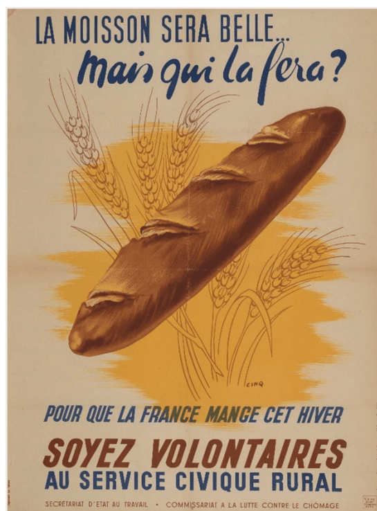
Figure 14 Publicité du Service civique rural produite par l'Office de publicité générale et signée Cinq, Paris, entre 1941 et 1945.

de publicité générale 88 représentant une baguette de pain fait par exemple écho à la longue baguette découpée dans le film de Lavoie.