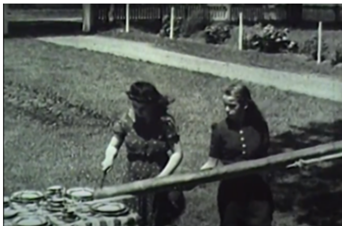
Figure 15 Découpe d'une immense baguette de pain. Sainte-Famille, île d'Orléans (Herménégilde Lavoie, vers 1940). Centre d'archives de Québec de BAnQ.

étaient retenus prisonniers en Allemagne); le dévouement du peuple impliqué sur le front et « à l'arrière » au Québec. On voit comment les images de Lavoie, tournées dans une perspective ethnographique, ont été instrumentalisées à des fins patriotiques par les producteurs de RKO-Pathé News .