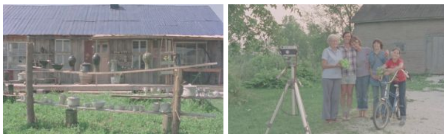
III. 11-12. Les Fleurs sauvages (Jean Pierre Lefebvre, 1982)