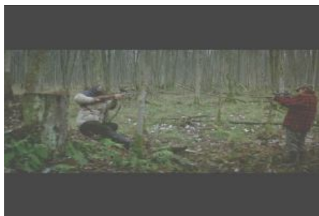
III. 6. La Battue (Guy Édoin, 2008)