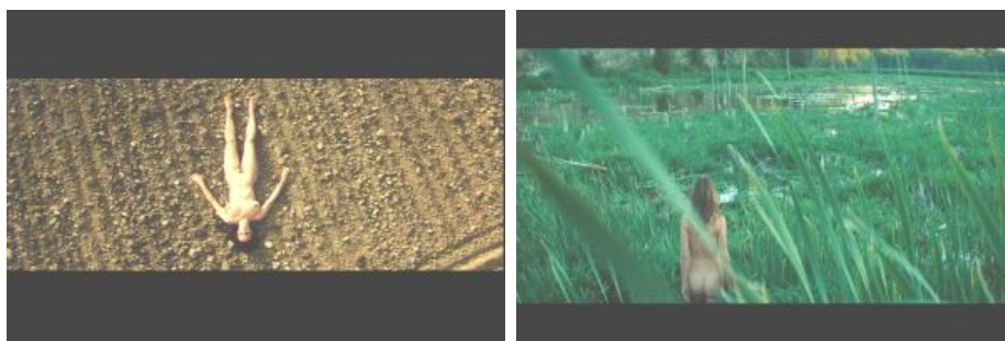
III. 2-3. Le Pont (Guy Édoin, 2004) et Marécages (Guy Édoin, 2011)