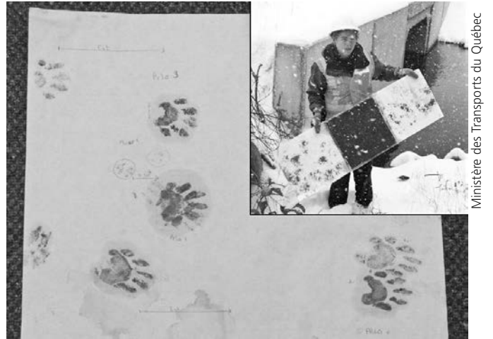
Figure 3. Pistes imprimées sur un tampon encreur installé dans un passage à petite faune de la réserve faunique des Laurentides, après 2 semaines d'utilisation.

Les tampons encreurs étaient constitués de panneaux de contreplaqué de 10 mm d'épaisseur, d'une longueur de 1,20 m et d'une largeur variant entre 400 et 650 mm selon la dimension du passage. Les tampons étaient divisés en 3 sections, soit 2 étampes servant à recueillir les pistes situées à chaque extrémité du tampon et une section chargée d'encre située au centre (figure 3). La section chargée d'encre était constituée d'un tampon de mousse (utilisé dans les