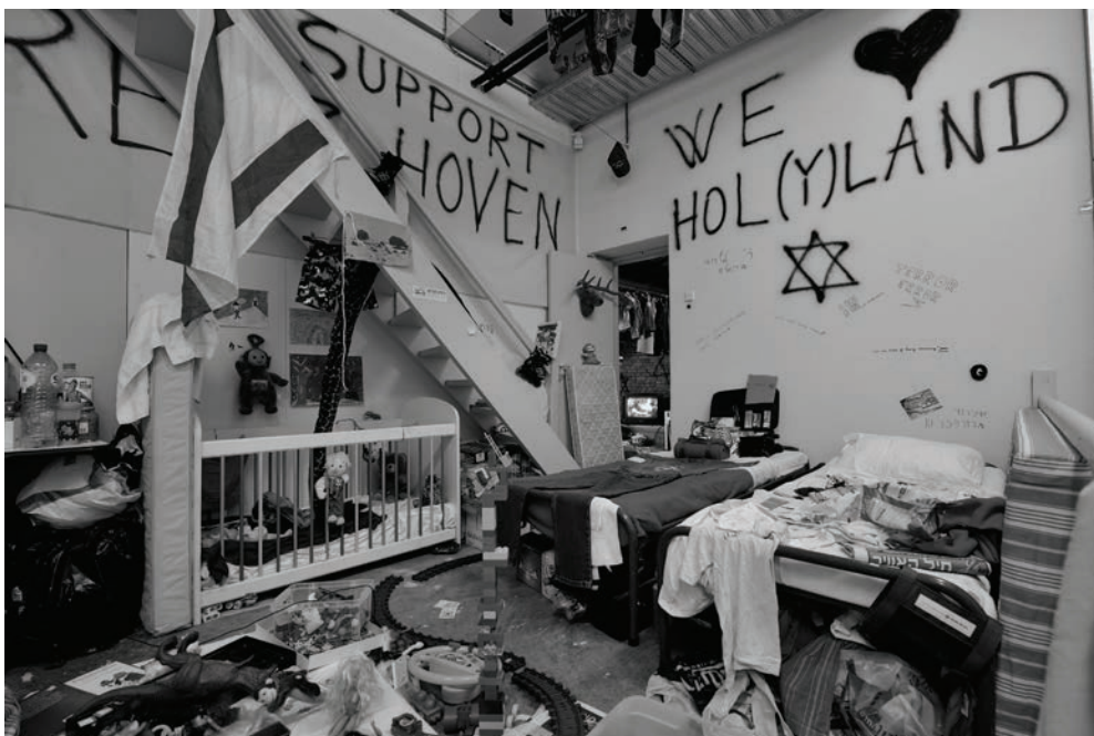
Michael Blum, "Exodus 2048", Van Abbemuseum, Eindhoven, 2008.