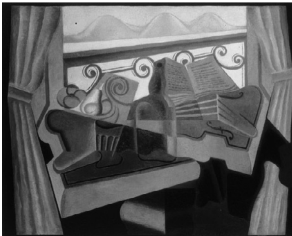
Illustration 1. Juan GRIS, La fenêtre aux collines , 1923. Huile sur toile (73 x 92 cm).

Dans La fenêtre aux collines , une rencontre intérieur-extérieur se produit, comme un jeu symbolique entre la notion d'intime et de publique [sic], entre art et vie, entre la poésie de la création et la poésie de la nature créatrice. Si la fenêtre ouverte fait allusion à l'impulsion vitale, à l'être au monde , le bouquet fait référence aux cinq sens : l'instrument de musique à l'ouïe, le vin et le fruit au goût et à l'odorat, la peau des fruits et les courbes des objets au toucher, la fenêtre et le livre ouverts à la vue. La sensualité n'était pas courante dans le cubisme « classique », cependant Juan Gris la récupère dans la maturité de son œuvre.