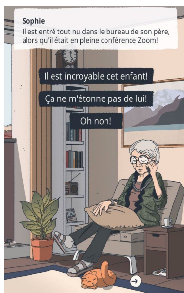
Figure 3. Anecdote cocasse lors d'une conversation téléphonique entre Suzanne et sa fille.

À plusieurs reprises dans QAUC , les mises en scène sont également utilisées pour évoquer la répétition et l'ennui vécu durant le confinement. Pour montrer à quel point Suzanne et Patrick sont désœuvré·e·s, par exemple, on les retrouve toujours au même endroit dans leur salon d'une scène à l'autre. L'insertion d'un téléphone dans le décor des personnages nous a en outre permis de mettre en scène des appels téléphoniques avec leurs amis ou familles afin que le·la joueur·se puisse voir comment le semi-confinement les affecte. Les dialogues furent soumis à plusieurs phases de réécriture afin de trouver le bon ton et de rendre compte, d'une part, de la gravité de la situation, tout en gardant, d'autre part, une touche de légèreté et d'humour pour ne pas déprimer le·la joueur·se. Nous avons décidé de faire cohabiter des sujets sérieux, tels que la perte d'un emploi ou la solitude, avec des anecdotes cocasses comme celle de la fille de Suzanne qui raconte que son fils est entré nu dans le bureau de son père alors qu'il était en pleine visioconférence (voir figure 3).