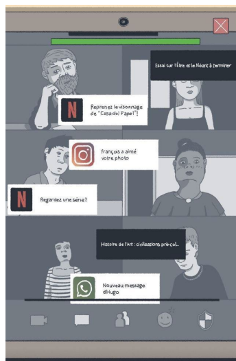
Figure 2. Extrait du mini-jeu présent à deux reprises dans l'arc narratif de l'étudiant.

Le premier mini-jeu proposé dans QAUC implique l'étudiant, Damien, tentant de suivre un cours en ligne malgré les distractions. Inspiré du rythme des jeux Beatmania (Konami, 1997) et Taiko no Tatsujin (Namco, 2001), des blocs représentant les cours d'université défilent du haut vers le bas de l'écran alors que le·la joueur·se doit cliquer dessus lorsqu'ils atteignent la zone cible, tout en évitant de cliquer sur les blocs de « distractions » (voir figure 2). Assez simple lors de sa première occurrence, une version plus difficile de ce mini-jeu est proposée ultérieurement dans le jeu : les blocs dévalent alors plus rapidement à l'écran, symbolisant la fatigue causée par plusieurs mois de visioconférence. Réussir les mini-jeux n'est toutefois pas nécessaire pour progresser dans l'histoire. Le·la joueur·se peut d'ailleurs décider de ne pas les faire.