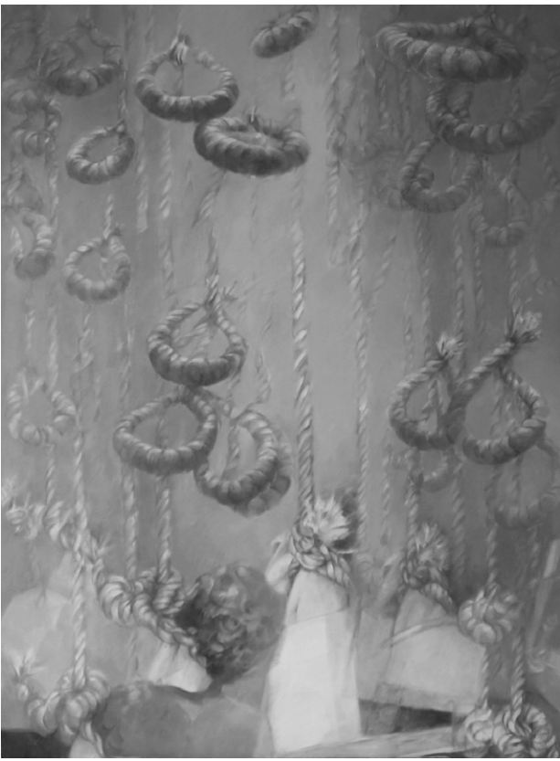
M. Lepeeur, Ces cordés qui nous pendent au nez (2002), huile sur toile.

et des pulsions qui animent les familles des victimes. On pourrait penser, au premier abord, qu'il s'agit là d'une sorte de concession faite au camp adverse. On notera, cependant, que cette « concession » n'est pas faite du bout des lèvres : les orateurs clament haut et fort leur « compréhension » de la « douleur » et du « désir de vengeance » des familles des victimes. Le verbe « comprendre » paraît bien ici être le mot clé : on relève son occurrence dans trois des extraits [en 1), 3) et 4)]. Il se voit même renforcé, en 1), par un adverbe : il ne suffit pas de comprendre le désir « naturel » de vengeance des familles des victimes, encore faut-il le comprendre « parfaitement ». En 3), l'orateur fait mine de s'interroger : « Ai-je ici besoin de dire que je comprends et que je ressens la peine des victimes et de leurs familles et que je me sens très proche d'elles dans leur malheur ? » On a ici une question rhétorique, qui tend à la prétérition : elle suggère l'évidence et, par là même, la pleine légitimité d'une disposition affective qui, du coup, se passerait presque de mention explicite au sein du discours.