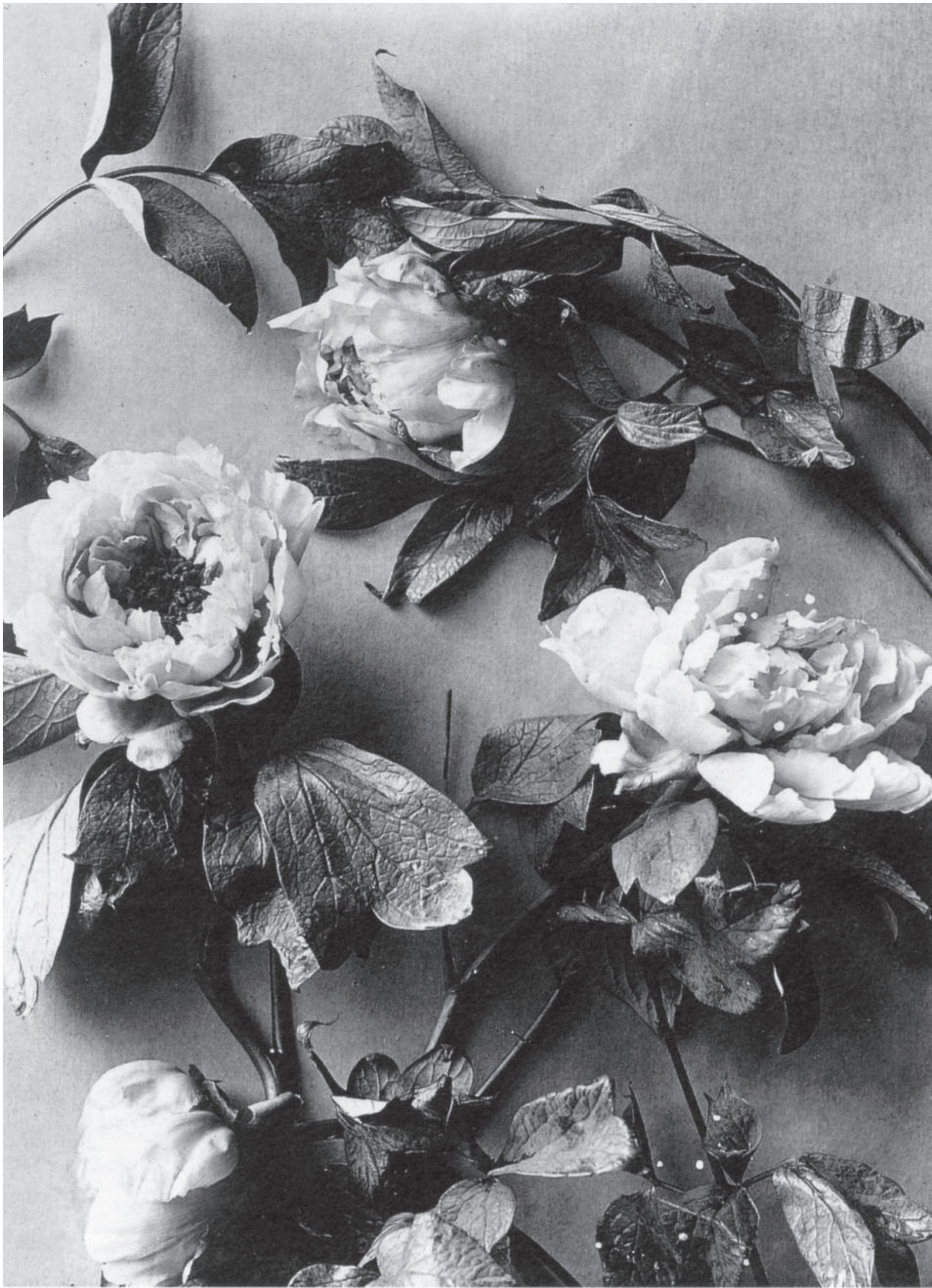
Anonyme. Blumenstudie, ca. 1890-1900 Fotomuseum München

main était plus propre à ce ministère que celle de ce sage chancelier, qui, dans la vue de sa mort prochaine, ne tenant presque plus au monde, et portant déjà l'éternité dans son cœur, entre l'espérance et la miséricorde du Seigneur, et l'attente terrible de son jugement, méritait d'achever l'œuvre du prince, ou pour mieux dire l'œuvre de Dieu, en scellant la révocation de ce fameux édit, qui avait coûté tant de sang et tant de larmes à nos pères ? (Fléchier, 1774, p. 339-342)