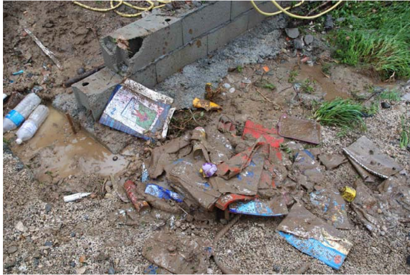
Fig. 2 – Des effets personnels « pêle-mêle » suite à l'inondation du Neez (Anne Tricot, mai 2007)