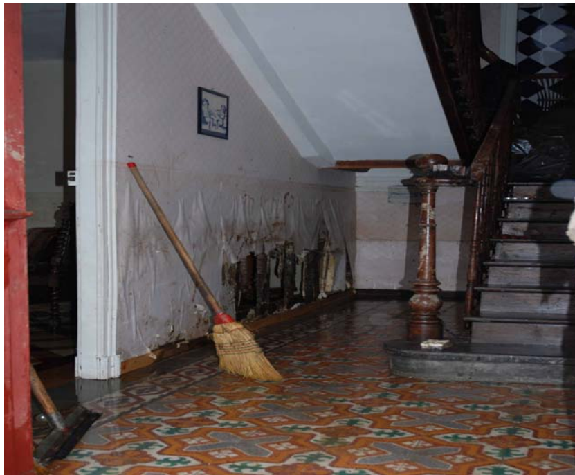
Fig. 3 – Les gens nous laissaient entrer comme si ce n'était plus chez eux (Anne Tricot, mai 2007)