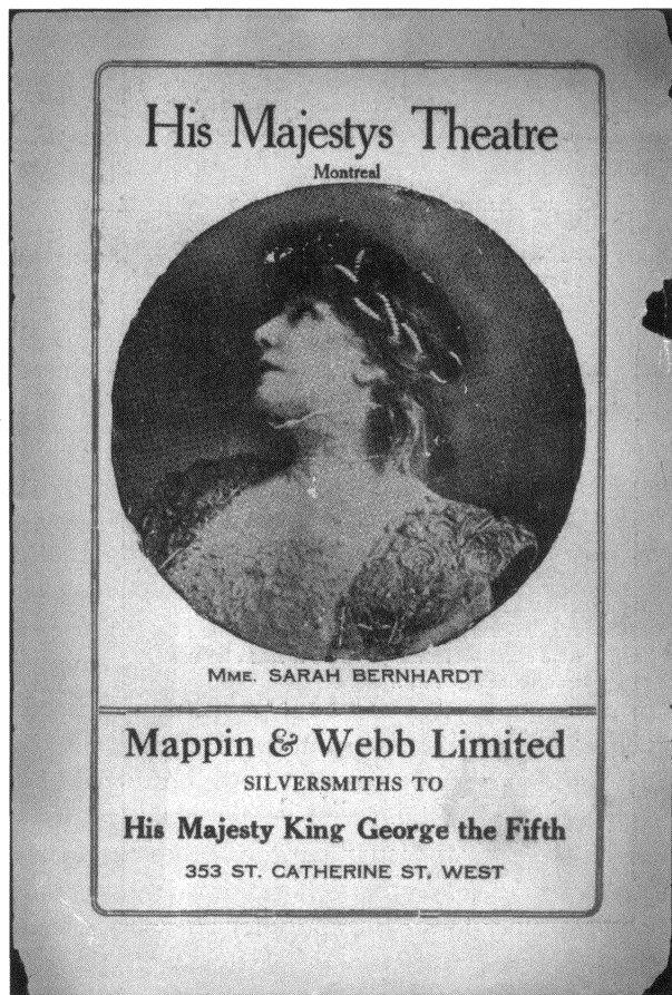
His Majestys Theatre, M me Sarah Bernhardt With her Distinguished Company and Production from the Theatre Sarah Bernhardt, Paris, Montréal, His Majestys Theatre, [1916]. Programme de théâtre, 15 x 22 cm.

Les logiciels et les documents électroniques sur support matériel totalisent environ 3 200 titres. Les logiciels sont souvent des applications spécialisées ou des mises à jour de logiciels couramment utilisés. Les documents électroniques, généralement sur cédérom, sont des productions multimédias interactives, des didacticiels, des jeux, des bases de données, des dictionnaires ou des répertoires divers. Les publications diffusées sur Internet constituent une collection récente, constituée à partir de 2001. Cette collection se compose principalement de monographies et de publications en série d'une vingtaine de ministères et d'organismes du gouvernement du Québec. Au cours des prochaines années, la collection s'étendra aux secteurs parapublic et privé.