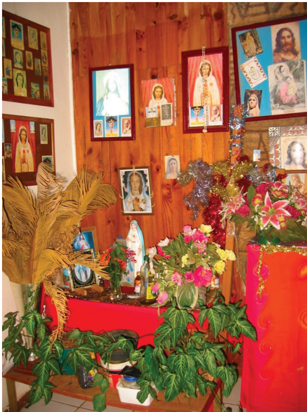
Illustration 1. Partie d'un autel domestique, Wallis, 2005.