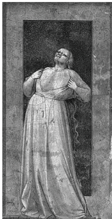
Figures 1 et 2. À gauche, La Justice ; à droite, La Colère . Giotto, vers 1306, Chapelle des Scrovegni à Padoue, Italie.