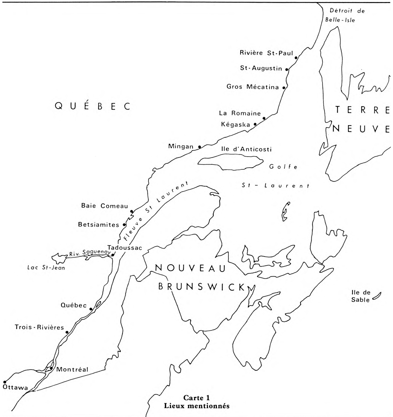
Carte 1 Lieux mentionnés