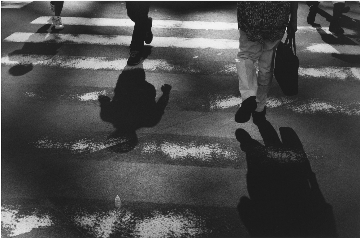
Pascal Dusapin, Tokyo mai 2014 .