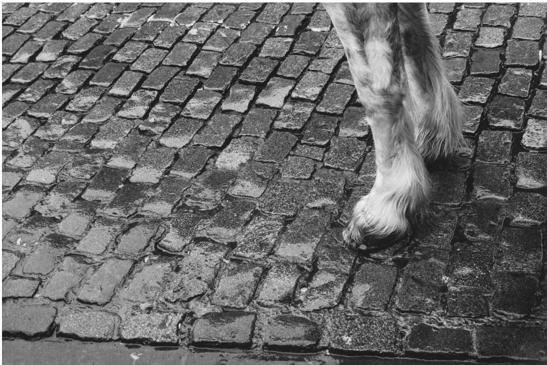
Pascal Dusapin, Bruxelles février 2015 .