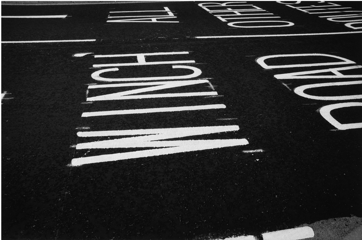
Pascal Dusapin, Basingtoke octobre 2018.