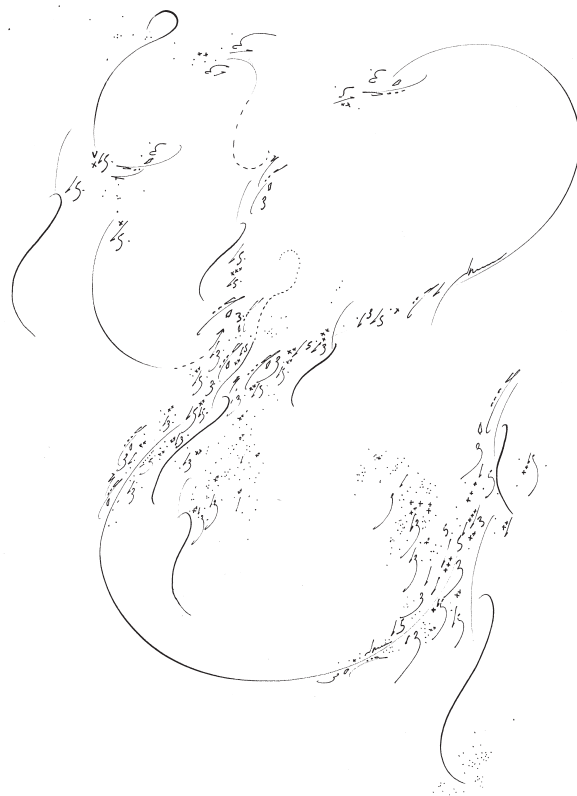
Pascal Dusapin, esquisse pour Mille Plateaux , 2014. Encre sur papier, 27 × 29 cm.