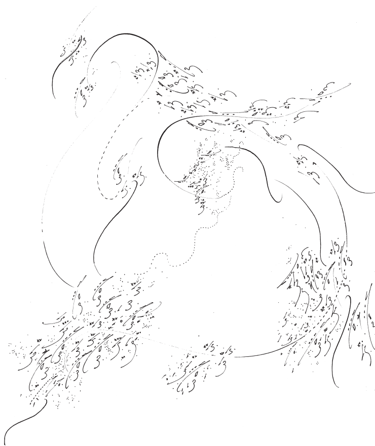
Pascal Dusapin, esquisse pour Mille Plateaux , 2014. Encre sur papier, 27 × 29 cm.