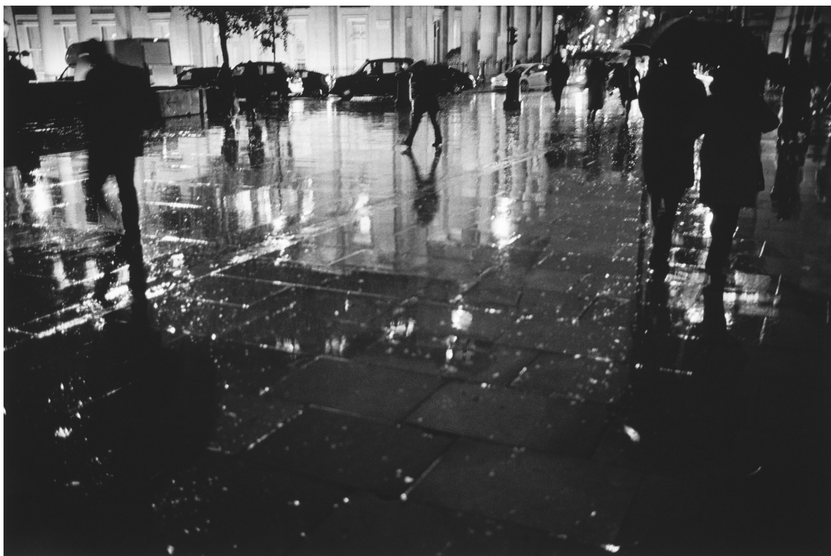
Pascal Dusapin, Londres novembre 2018 .