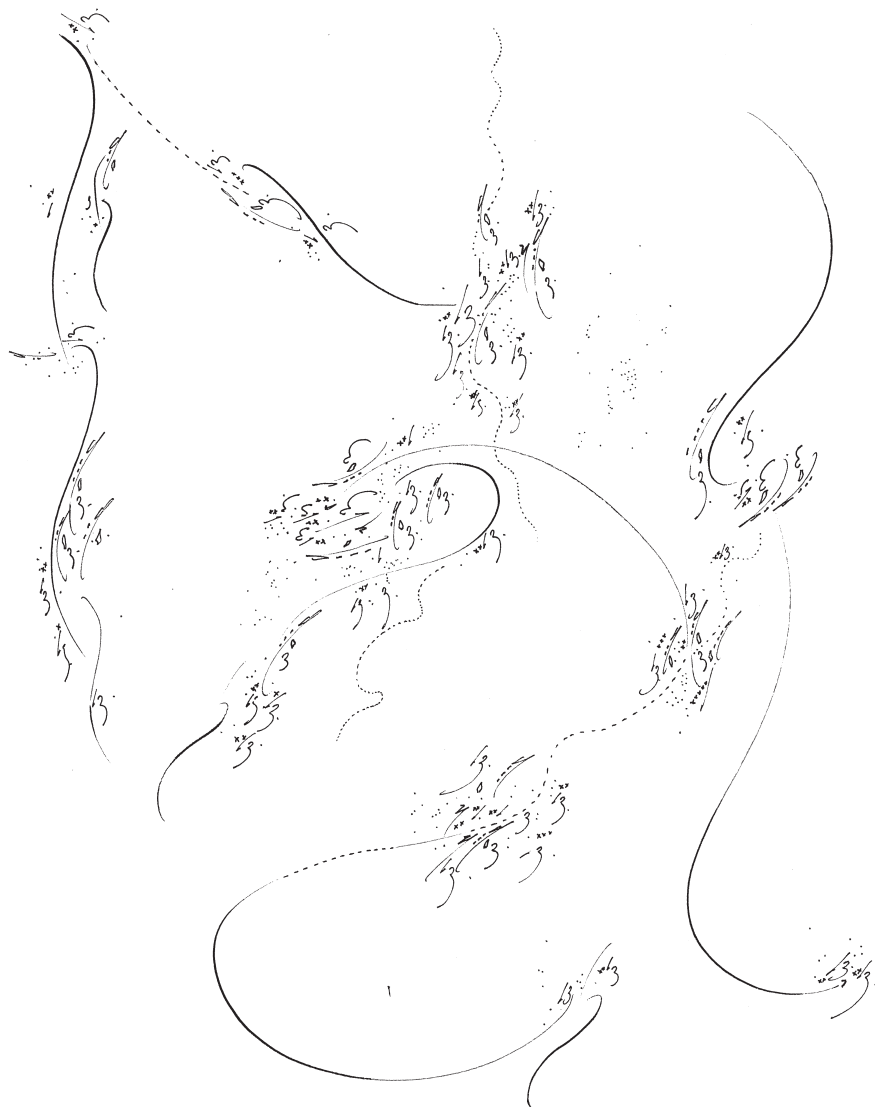
Pascal Dusapin, esquisse pour Mille Plateaux , 2014. Encre sur papier, 27 × 29 cm.