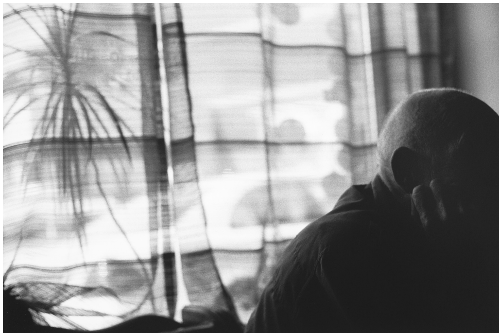
Pascal Dusapin, Witten mai 2011.

Ce numéro est illustré de photographies inédites, de dessins préparatoires pour Mille Plateaux (dont une image de l'installation figure en quatrième de couverture), mais aussi d'une page manuscrite de At Swim-Two-Birds (2015-2016), pour violon, violoncelle et orchestre, d'une autre de l'opéra Passion (2006-2007) et d'une esquisse du huitième opéra de Dusapin, Macbeth Underworld , qui sera créé en septembre 2019 à la Monnaie de Bruxelles.