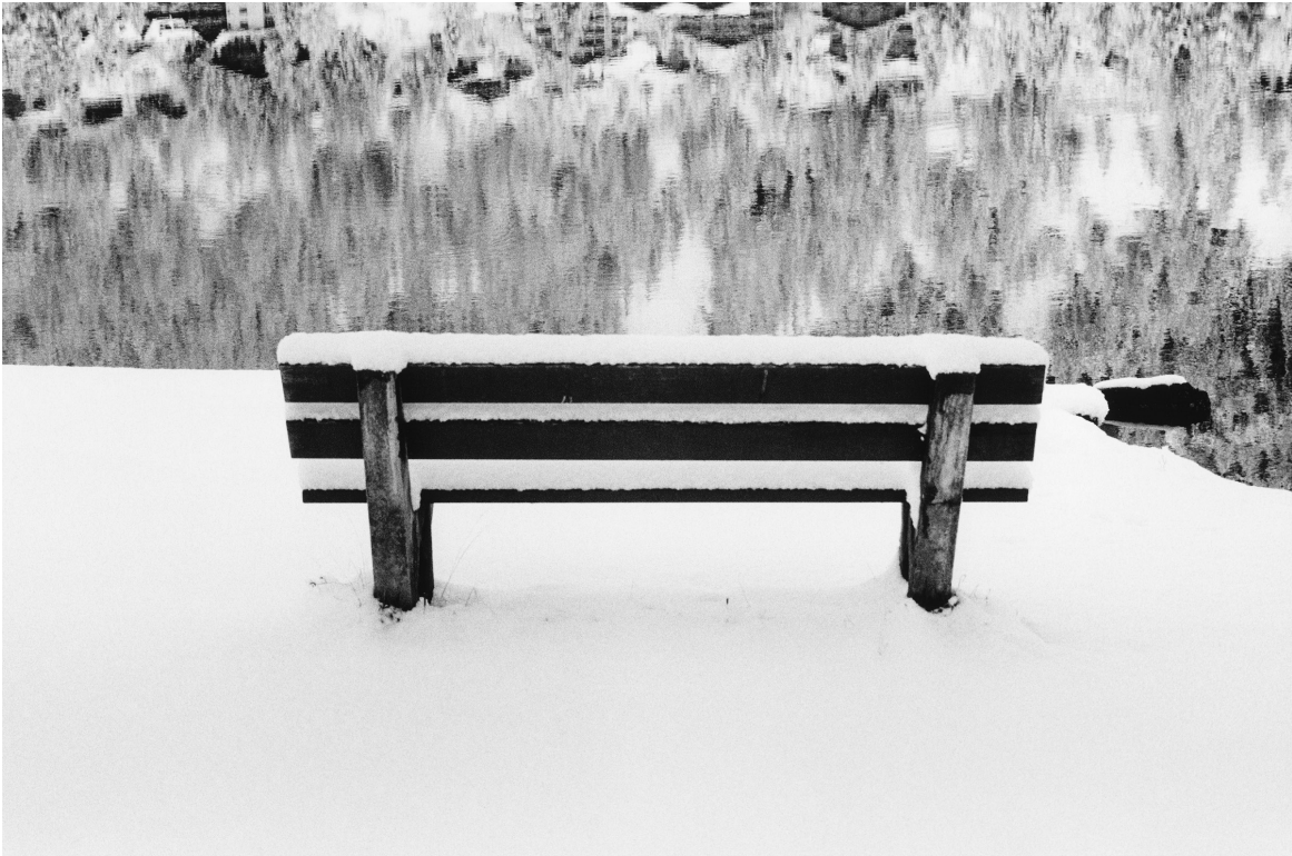
Pascal Dusapin, Suisse Champex 2012.