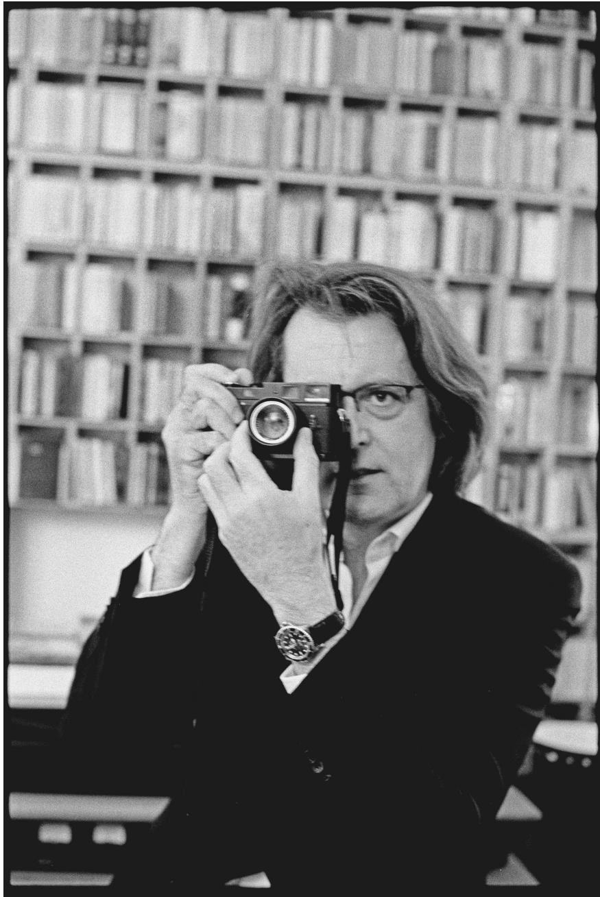
Martine Franck, portrait de Pascal Dusapin, Paris, 2008.