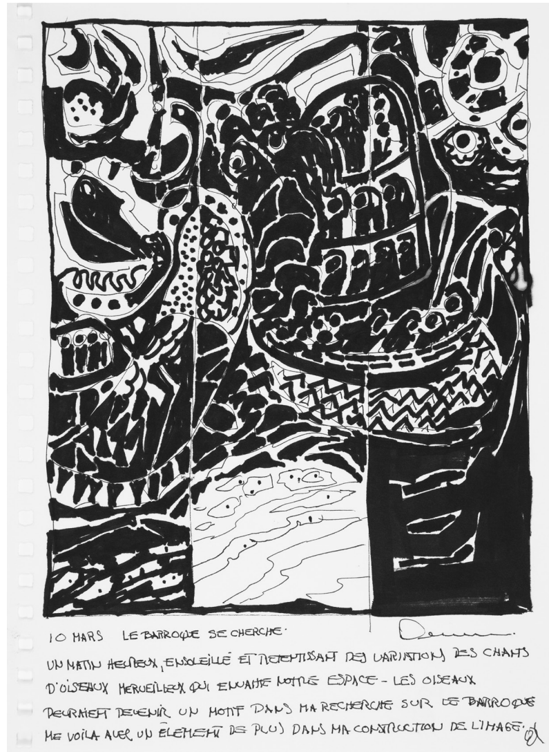
René Derouin, «10 mars – Le baroque se cherche», esquisse pour Paraíso. La dualité du baroque , 1997. Dessin et texte à l'encre, 60 × 48 cm. © René Derouin/Sodrac (2018).

au Québec, au Canada et à l'étranger, plus spécifiquement au Mexique où il a reçu l'Ordre de L'Aigle aztèque, le plus grand honneur du gouvernement mexicain pour les étrangers. Ses œuvres ont également été exposées en France, aux États-Unis, au Venezuela, en Australie et au Japon, et on les retrouve dans plusieurs collections nationales et internationales. Il est récipiendaire de l'Ordre national du Québec, de l'Ordre du Canada, du Prix du Québec Paul-Émile-Borduas 2 , ainsi que du prix Compagnon des arts et des lettres du Québec.