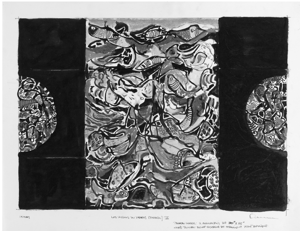
René Derouin, Les poissons du Paradis II (Paraíso) , 1997. Pastel, 48 × 60 cm. Musée de la civilisation, don de Michel Lorrain, 2012-455. © René Derouin/Sodrac (2018).

4. Le kifuliru est une langue bantoue, parlée par la population fuliro de la République démocratique du Congo.