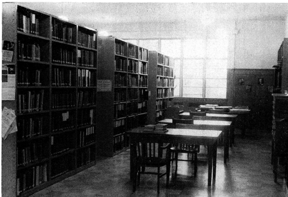
Intérieur d'une partie de la bibliothèque à Montréal.