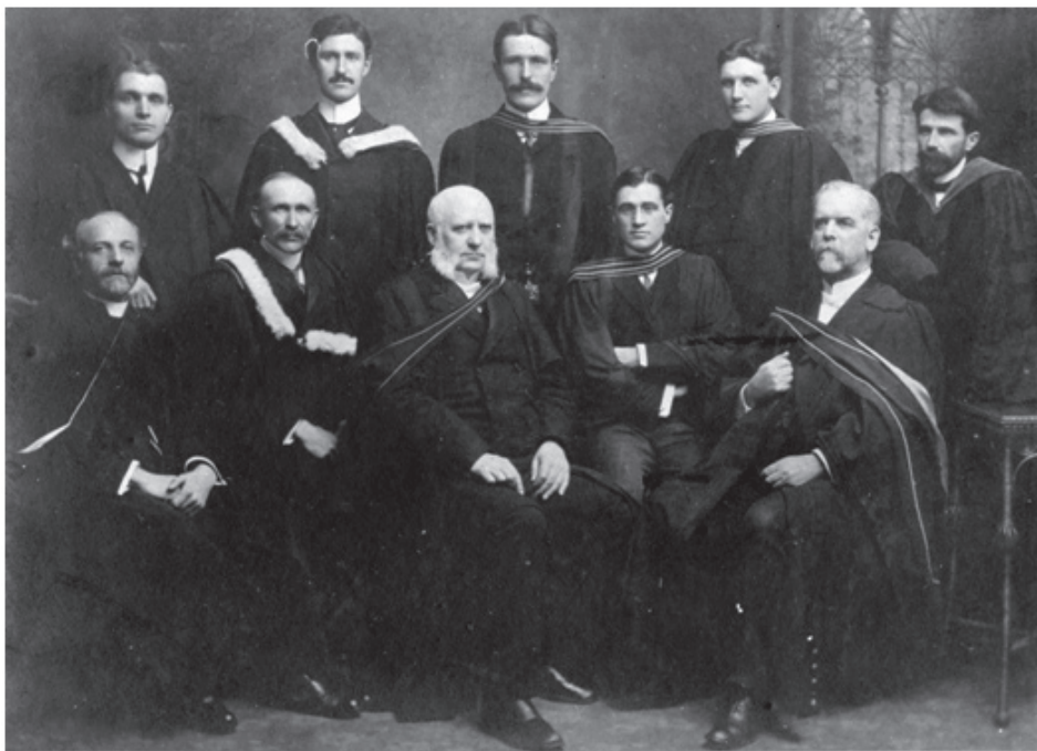
Figure 2 "Wesley College faculty members," 1908.