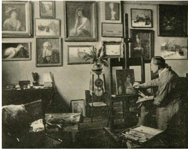
fig. 6. « L'artiste [Franchère] à son travail », La Revue moderne , 15 septembre 1920, p. 16.