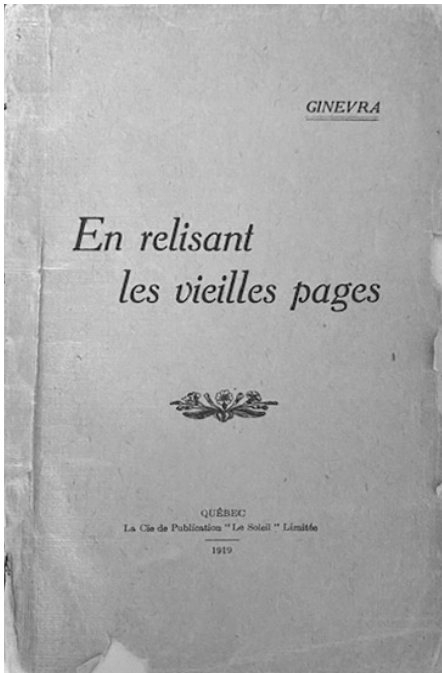
Page couverture, En relisant les vieilles pages .

Son premier recueil retiendra d'abord notre attention, à la découverte des secrets du bonheur enseignés aux jeunes filles, puis au fil de souvenirs nostalgiques de l'auteure attachée aux traditions. Comment survivre aux difficultés de la vie et vivre pleinement son destin de femme? Un deuxième recueil de Georgina Lefavre viendra ajouter des aspects nouveaux à son discours qui s'inscrit incontestablement dans son époque.