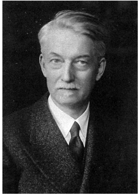
Jacques Maritain (1882-1973), philosophe français, dont s'inspire le groupe de La Relève . (Extrait du catalogue d'exposition Les grandes amitiés de Jacques et Raïssa Maritain , Toulouse, Éditions du Carmel, 1995, p. 86.)

Le Devoir du 3 avril 1933, qui présente les cours de Maritain à Toronto comme une tentative de réconciliation de « la culture moderne avec la philosophie de saint Thomas », annonce sa venue au Québec pour 1934, dans le cadre de l'Institut scientifique franco-canadien [ISFC] dont Gilson est l'un des maîtres d'œuvre, et offre à ses lecteurs un résumé des cours faits à Toronto par ce catholique qui « fait resplendir en lui cette note d'universalité » de son Église 4 .