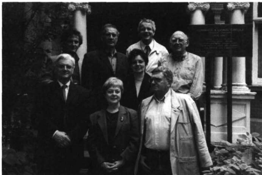
Rencontre des Dix à l'IHAF