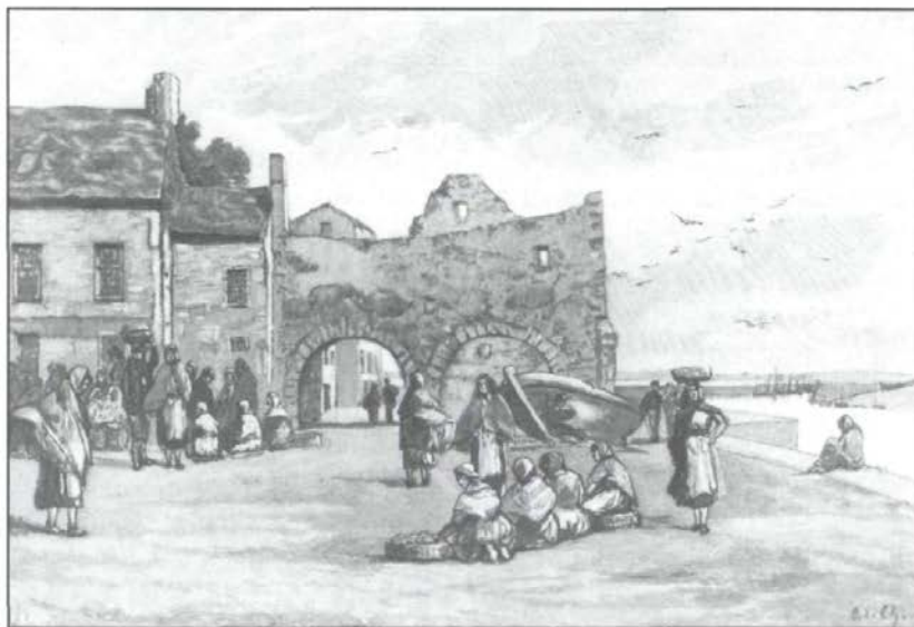
Le marché aux poissons à Galway — Dessin d'O. de Champeaux.