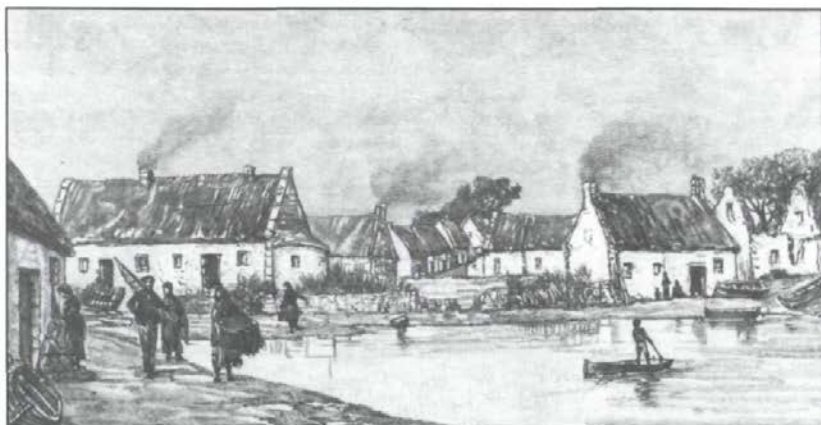
Vue de Claddagh à Galway — Dessin d'O. de Champeaux.

remarque à Kenmare: «Une chose qui m'attriste, c'est de voir que ce peuple a perdu sa langue et a subi sans l'apprendre, la langue du vainqueur. Les Canadiens français ne sauraient assez remercier la divine Providence de les avoir préservé de cette triste humiliation. Je n'ai pas entendu un mot d'irlandais; tous