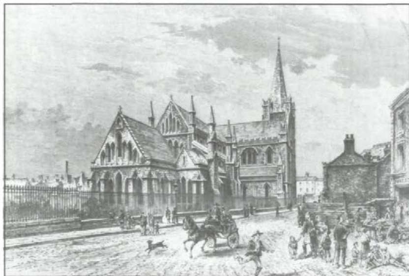
La cathédrale de Saint-Patrick, à Dublin — Dessin de Barclay.

mon âme au ciel» (53). Malgré tous les signes de la présence anglaise, Dublin «est une ville bien irlandaise, je vous l'assure», souligne Tardivel comme pour rassurer ses lecteurs (47).