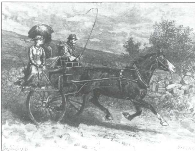
Jaunting-car

indépendant des partis politiques à une époque où il n'était pas aisé de l'être, il défend le Canada français et le catholicisme ultramontain avec l'ardeur d'un croisé. Si Routhier se promène en Irlande en touriste, Tardivel lui, y va pour se documenter, s'instruire et fourbir ses armes pour les luttes à son retour au pays. Durant son voyage, il adresse des correspondances à la Vérité de Québec et au Freeman's Journal de New York. Ses lettres à la Vérité seront publiées en volume sous le titre Notes de voyage en 1890 et largement répandu à l'instar de l'ouvrage de Routhier. L'Irlande y occupe une place de choix. Tardivel aborde lui aussi l'Irlande informé de bien des questions grâce à la pratique du journalisme et à des contacts avec les Irlandais du Canada et des Etats-Unis. Ses amis jésuites de Québec et de Montréal le mettent en contact avec leurs confrères irlandais qui le reçoivent dans tous les endroits d'importance où il passe. Ce sont eux, par exemple, qui lui font rencontrer Mgr Croke, archevêque de Cashel dont la photo illustre le livre de Tardivel.