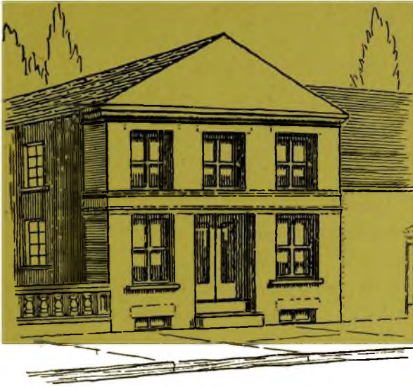
Annexe de la maison Dansau de Muy où fut fondé La Presse en 1884, et où fut la faculté de droit de l'Université Laval de Montréal jusqu'en 1895.

A une époque que nous ne pouvons préciser, l'on avait accolé au mur est de la maison dont nous parlons, une aile en briques de 24 pieds de front environ, rue Notre-Dame, sur plus de 120 pieds de profondeur. C'est dans cette aile que le journal La Presse fut fondé en 1884. De 1889 à 1894 ce fut là que furent donnés les cours de la faculté de droit de l'Université