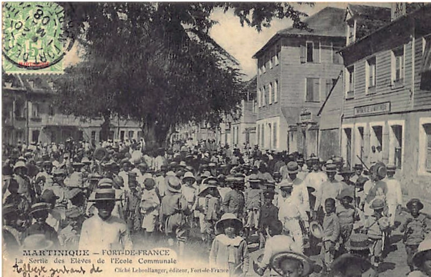
Carte postale : Martinique-Fort-de-France. La sortie des élèves de l'Ecole Communale. Cliché Leboullanger, éditeur, Fort-de-France. (Collection privée)

Cette étude fournit des pistes pour analyser cette période de transition entre une culture marquée par de fortes inégalités raciales, sociales et sexuelles, et une culture républicaine, émergente, porteuse de possibilités d'ascension sociale, davantage que de changement de l'ordre social et colonial.