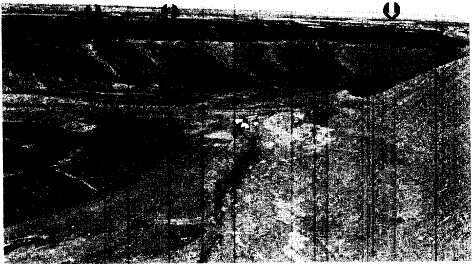
Figure 4a : Grappes de géoglyphes, région de Guatacondo. Plusieurs centaines de géoglyphes sont gravés le long de la partie foncée que forme la terrasse supérieure sud de Quebrada de los Pintados. Tous ces géoglyphes, y compris ceux de la terrasse nord, peuvent être vus depuis un campement situé au fond de la quebrada . Les flèches indiquent un motif en « damier » (textile), une file de camélidés, dont chacun mesure près d'un mètre de haut, et un cercle.