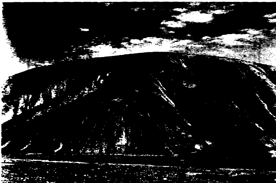
Figure 4b : On voit approximativement soixante géoglyphes, la plupart très érodés, situés sur une pente alluviale au nord de Quebrada Maní.

De plus, les lignes droites et trapézoïdales caractérisent exclusivement les géoglyphes situés sur une surface horizontale. En somme, le style et les thèmes des géoglyphes du nord du Chili sont distincts de ceux de Nazca et je ne crois pas que ces deux traditions picturales soient reliées l'une à l'autre, de la même façon que la présence de poterie dans deux régions ne signifie rien de plus que l'usage de poterie dans ces régions. Les thèmes des géoglyphes biomorphes de Nazca se trouvent sur de la poterie que l'on peut clairement dater de la culture Nazca (200 av. J.-C. -700 ap. J.-C. ). De même, on peut relier les thèmes de certains géoglyphes du nord du Chili à du matériel archéologique, notamment à des boucliers de cuir datant de 1000 ap. J.-C. et à l'iconographie textile associée à la culture Alto Ramírez (allant de 500 avant à 500 après J.-C. ) de cette région (Santoro et Dauelsberg 1985). Il semble ainsi que les peuples andins anciens privilégiaient le même type de surface pour « graver » des images. Cependant, il est important de noter que toutes les surfaces « appropriées » du point de vue géomorphologique n'étaient pas utilisées comme surface à dessin. Il existait visiblement d'autres critères opératoires de sélection.