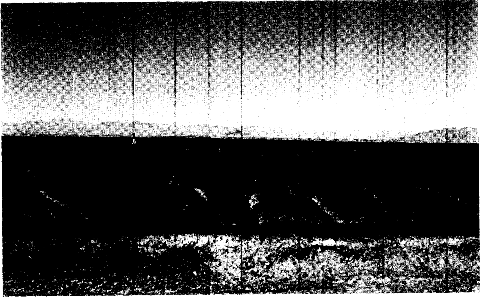
Figure 3 : Panneau situé près de Quebrada de los Pintados qui représente, sur la gauche, deux camélidés tournés vers la droite et, sur la droite, quatre personnages anthropomorphes. La personne debout à gauche du panneau montre que le dessin correspond à une échelle réaliste (photo de J. Blakey).