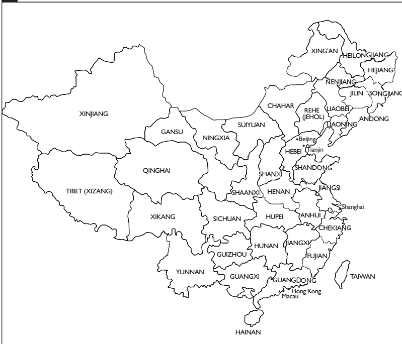
FIGURE I CARTE DE LA CHINE

dans la voie du développement. Appuyées par le gouvernement central, les autorités locales ont tenté d'attirer des investissements de l'extérieur. De nouveaux règlements ont été établis afin de promouvoir l'injection de capitaux supplémentaires et les politiques démodées ont été abolies pour laisser place à la construction. De nouvelles usines ont été construites pour répondre aux besoins des marchés intérieur et extérieur. Comme la nouvelle ville de Shenzhen a rapidement cessé d'être un simple village côtier, de nouveaux projets d'infrastructure comme les routes, les stations services et les usines d'eau de conduite ont été lancés pour répondre à la demande qui montait en flèche.