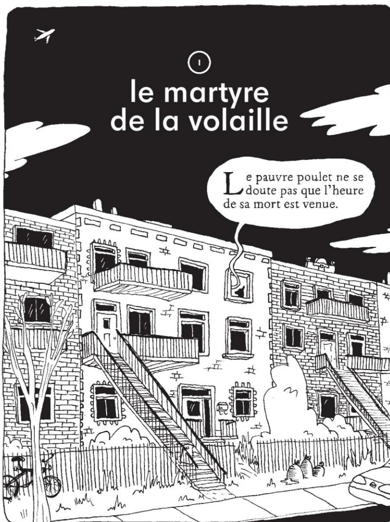
Poulet grain-grain , p. 7

des poules heureuses. La sortie de Montréal est d'ailleurs le moteur narratif de l'œuvre et l'opus repose à la fois sur un dessin minimaliste et une dynamique humoristique entre les personnages qui sont excessivement verbomoteurs. Le registre de Poulet grain-grain est ainsi très près de celui de La pitoune et la poutine , à la fois ludique et ironique.