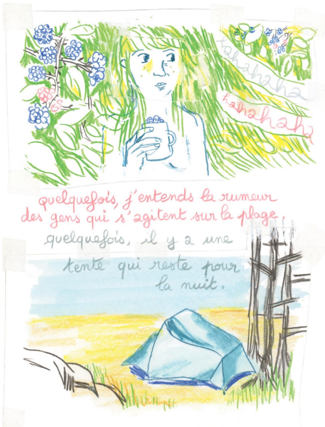
Je vois des antennes partout, n.p.

utilisés pour représenter à la fois la verdure et les cheveux de la jeune femme, comme si ceux-ci s'entremêlaient, métaphore de l'union entre le personnage et la forêt.