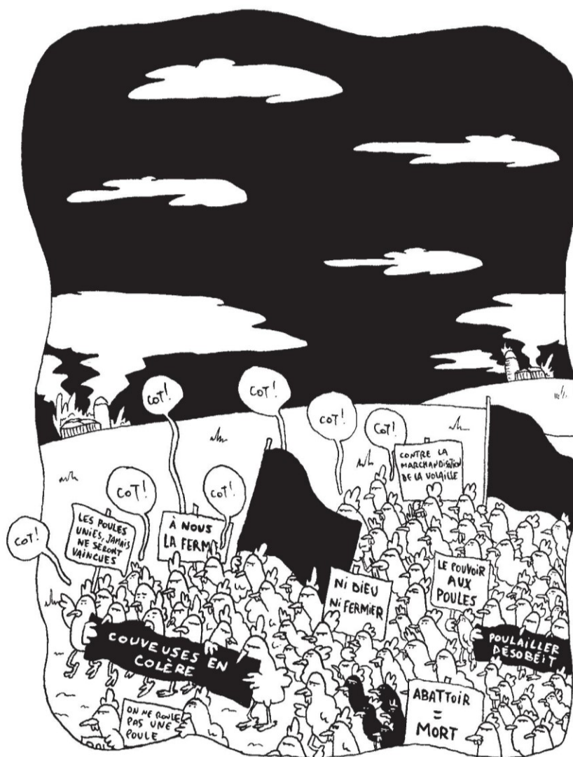
Poulet grain-grain , p. 103

l'instigateur de l'exil rural dans Poulet grain-grain remet en doute les possibilités de faire une réelle révolution. Ces doutes ne sont évidemment pas de même nature et provoquent chez le personnage un délire paranoïaque qui débouche sur un rêve farfelu. Alors qu'il est fiévreux, le nouveau fermier rêve qu'une révolte s'organise parmi ses poules, comme en témoigne la planche de la page 103. On y voit une manifestation de poules mécontentes qui tiennent des pancartes sur lesquelles on peut lire des slogans qui rappellent ceux de la grève étudiante de 2012 : « Les poules unies, jamais ne seront vaincues », « Couveuses en colère », « À nous la ferme », etc.