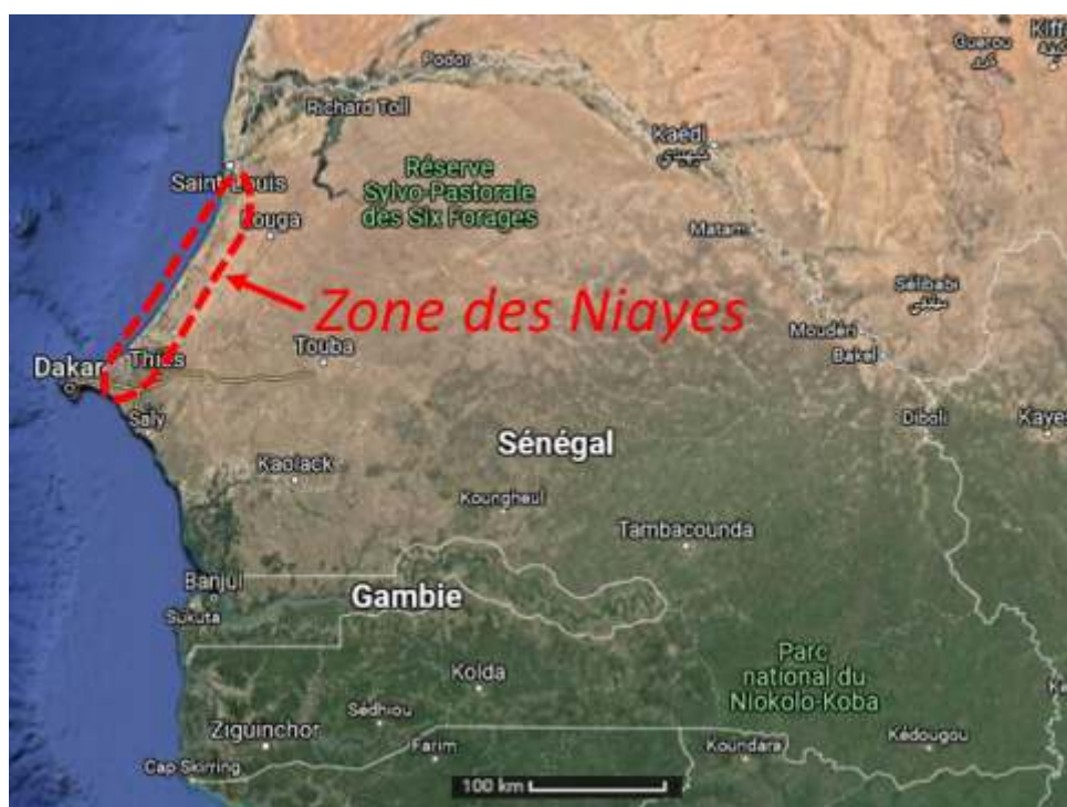
Carte 1. Localisation de la zone des Niayes, principal bassin de la production maraîchère au Sénégal.