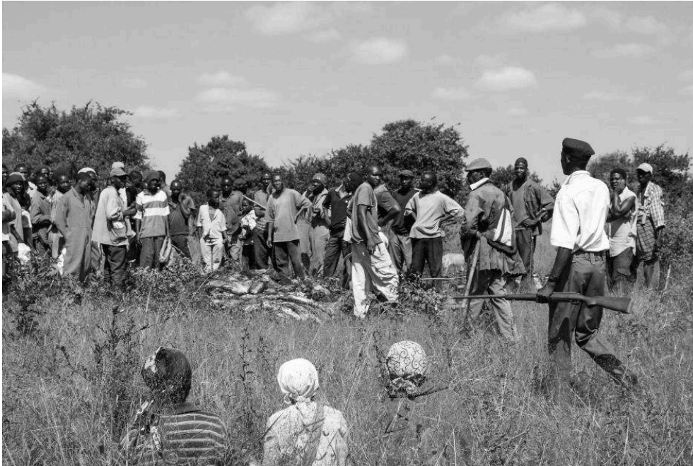
Figure 4. Agriculteurs attendant la distribution de viande autour d'une carcasse, suite à l'abattage d'un éléphant dans une zone communale à la frontière du parc national de Hwange.

Au premier plan, les femmes qui se tiennent à l'écart, au second, un garde des parcs nationaux.