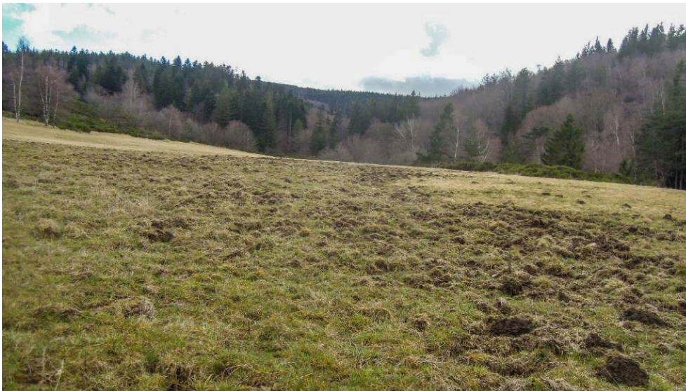
Figure 2. Dégâts de sanglier dans une prairie du mont Lozère, dans le parc national des Cévennes.