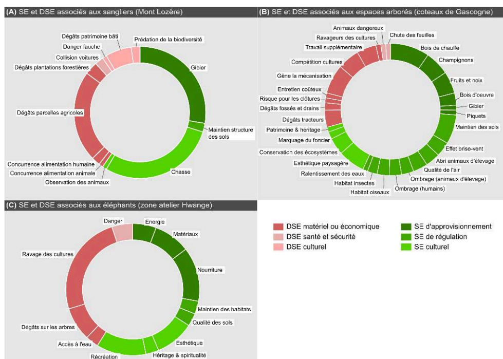
Figure 1. Synthèse des services écosystémiques (SE) et disservices écosystémiques (DSE) identifiés dans les trois cas d'étude.

(A) Cas du sanglier dans le mont Lozère; (B) Cas des espaces arborés dans les coteaux de Gascogne; (C) Cas des éléphants dans la zone atelier Hwange. La largeur de chaque portion correspond au nombre relatif d'enquêtés ayant évoqué le SE ou DSE en question.