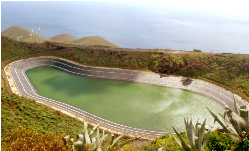
Figure 6. Le barrage supérieur de la centrale hydraulique d'El Hierro. En contrebas, les éoliennes l'alimentant en eau de mer dessalée. La Calderita, février 2014.

20 La référence au Garoé des Guanches pour la centrale hydro-éolienne permet aussi l'ancrage de la transition énergétique dans la normalité au sens de la tradition.