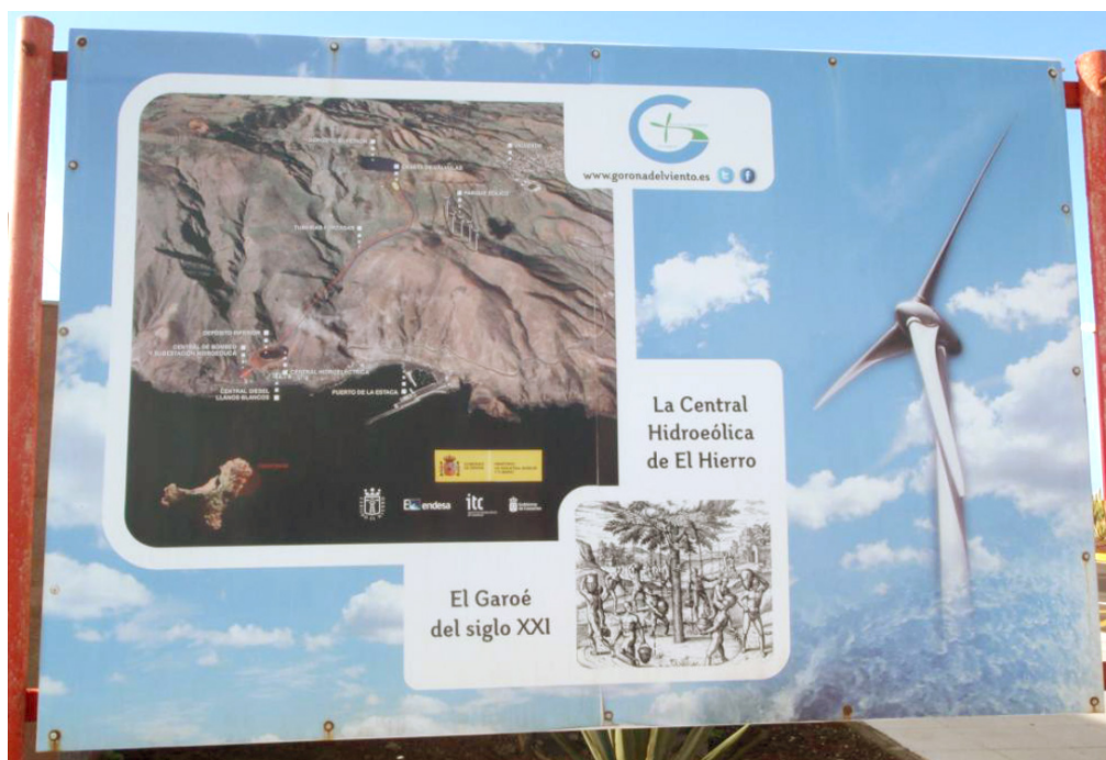
Figure 4. Le grand panneau de l'aéroport où l'ancien arbre-fontaine, le Garoé des aborigènes Guanches, est la métaphore de nouvelle centrale hydro-éolienne d'El Hierro. Février 2014.