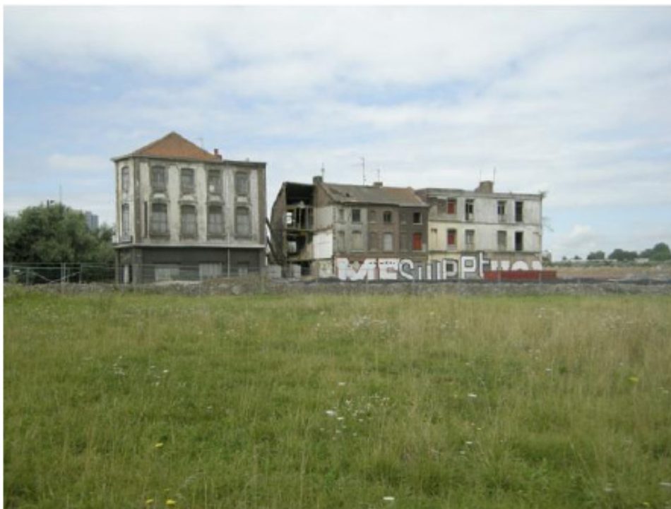
Figure 2. La zone de l'union. Anciens logements

29 La zone de l'Union, comme de nombreux espaces façonnés par une désindustrialisation rapide, est caractérisée par des mécanismes de cumul des inégalités, sociales et écologiques. Ces cumuls résultent des risques (pollutions des sols, sanitaires...) que rencontrent les populations à cause des externalités environnementales historiquement peu ou pas prises en compte dans les politiques de développement de ces territoires (Guillerme, 2010). Si la situation concerne, globalement, les sociétés industrielles (Beck, 2002), elle est particulièrement présente sur ces territoires. Cet héritage doit désormais être intégré dans les politiques de rénovation de ces espaces, s'ils veulent mettre en place des politiques qui englobent, conjointement, la prise en compte des inégalités sociales et écologiques (Laigle et Oehler, 2004).