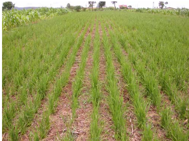
Figure 9. Riz pluvial en SCV sur couverture morte (Madagascar, Hautes Terres, site de référence TAFA)