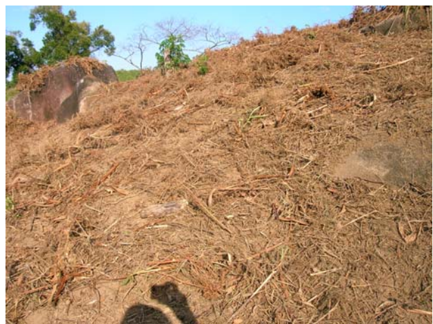
Figure 6. Paillis de résidus de défriche déposé sur un sol sarclé et planté de semenceaux de gingembre (Madagascar, Tolongoïna). Les espèces vivaces sont entassées sur les pierres.

Certaines légumineuses (haricot niébé, pois de terre...) et cucurbitacées rampantes associées à une céréale pourraient être assimilées à une couverture vive mais celle-ci n'est pas permanente et la couverture reste très partielle.