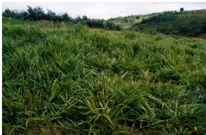
Figure 11. Couvert de brachiaria comme culture fourragère et jachère améliorée à reprendre en SCV après destruction par fauche et glyphosate (Madagascar, HT, site de référence TAFA)