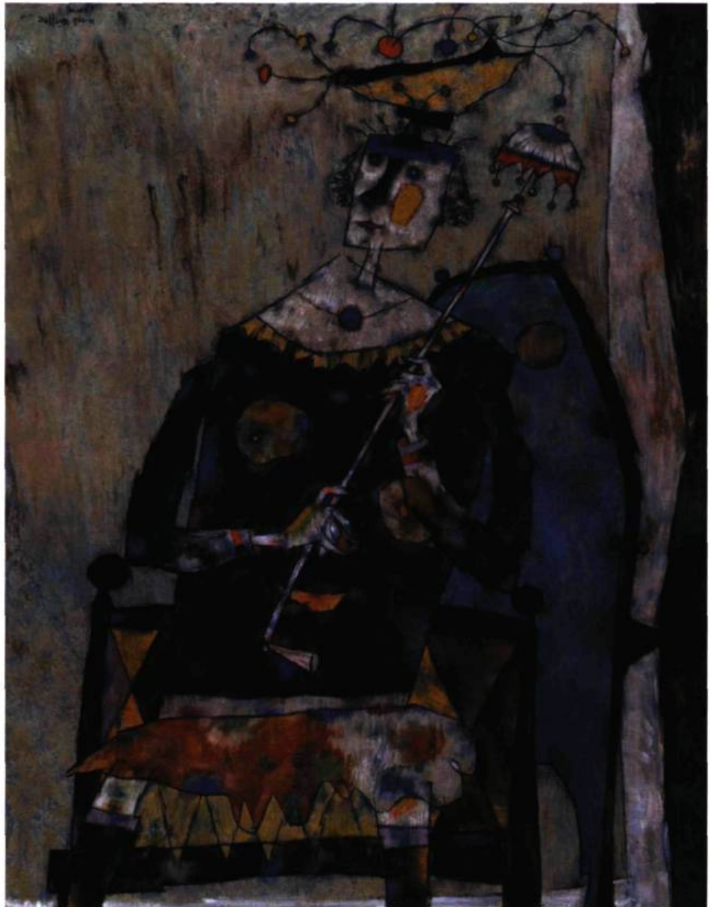
Bossue à l'ombrelle 1960-1961 Huile 116 x 69 cm