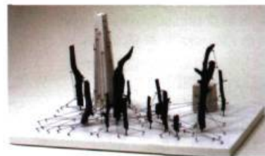
George Vergette Study for a unique Structure #16, 2007 Bois, corde de nylon, corde de musique, acrylique, hydrocal 20,5 x 30,5 x 18 cm

Heures d'ouverture: du mercredi au vendredi: 12h à 18 h Samedi: 12 h à 17 h