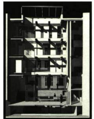
Galerie d'art DHC-ART (Projet)

Voué au soutien et à la présentation de l'art actuel, DHC/ART Fondation pour l'art contemporain ouvrira ses portes l'automne prochain. Dirigé par Phoebe Greenberg, ce nouvel espace, situé dans un édifice actuellement en rénovation dans le Vieux-Montréal, se propose d'accueillir quatre expositions solo ou de groupe par année pour présenter des œuvres n'ayant jamais été vues à Montréal. La Fondation envisage de soutenir des projets inédits par le biais de commandes annuelles auprès d'artistes canadiens établis ou émergents qui conduiraient à la réalisation d'une nouvelle œuvre majeure ou d'un nouveau corpus d'œuvres exigeant le recours à une variété de techniques. Des artistes et des commissaires seront invités à collaborer à des projets de recherche, de conception et de production d'expositions. Seront également organisés des événements et des programmes d'activités favorisant une meilleure compréhension de l'art auprès de publics non spécialisés. La Fondation annonce sa participation à titre de commanditaire exclusif à l'exposition de David Altmejd au Pavillon canadien de la Biennale de Venise 2007 en collaboration avec la commissaire Louise Déry de la Galerie de l'UQAM. Une exposition de David Altmejd coïncidera peut-être avec l'ouverture de la Fondation DHC/ART au cours de l'automne 2007. MGB