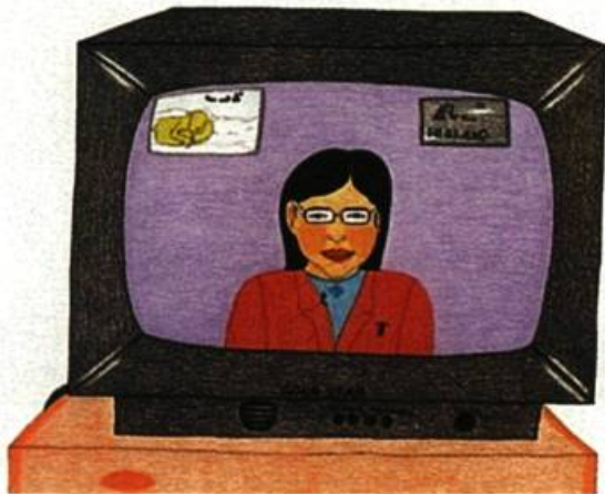
Le journal télévisé, 2002-2003 Crayon de couleur sur papier 49,5 X 66 cm Collection privée