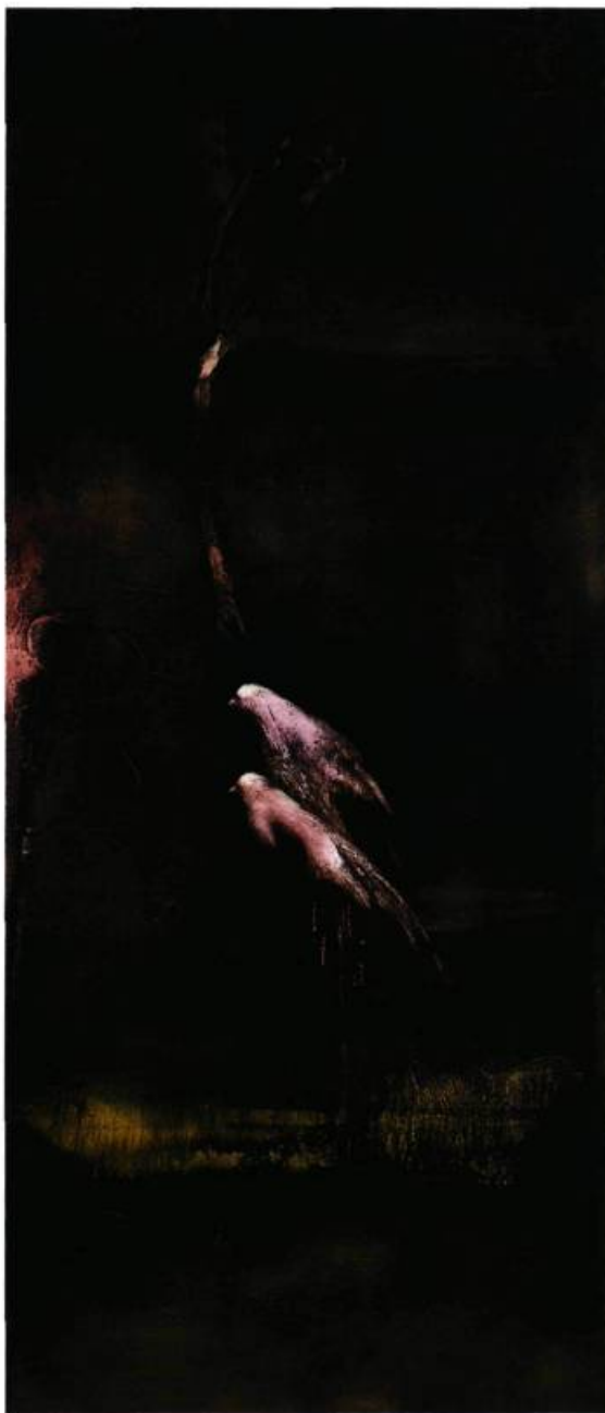
Gli ultimi sposi III , 2002 Technique mixte sur toile 213 x 91 cm

«Je peins les objets comme je les pense, non comme je les vois», déclarait Picasso, et les sciences et théories d'aujourd'hui acceptent de plus en plus souvent ces réactions empreintes de subjectivité comme des éléments valables dans une pensée. Cet enrichissement est d'autant plus évident dans les œuvres de Maranda que les différences qu'elles affichent face aux critères esthétiques habituels ne sont jamais des affirmations de ces différences. Devant les toiles inspirées des fameux Fioretti poétiques de Saint François d'Assise, par exemple, il ne nous vient pas à l'idée de nous poser la question de l'abstraction ou de la figuration. Nous sommes simplement devant une matière nouvelle dont les couleurs de terre, les reliefs et les présentations diverses qui semblent plus être des dérives que des recherches de vérité, font que nous l'acceptons comme une part intrinsèque de notre monde et de notre humanité. Il s'agit en majorité d'évocations d'oiseaux. Et le terme d'évocation n'est pas employé au hasard. En effet,