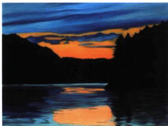
Nycol Beaulieu 9 e soir, 2000 Huile sur toile 122 x 163 cm

Nycol Beaulieu rejoint, dans une commune recherche autour du paysage nordique québécois, les artistes Luc Bergeron et Suzanne Joubert.