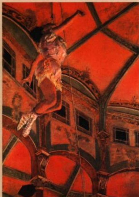
Edgar Degas Mlle Lala au cirque Fernando , 1879 Huile sur toile, 117 x 77 cm Londres, The National Gallery

Fruit de la collaboration de trois musées : Art Gallery of Ontario, Tate Britain (Londres) et le Musée d'Orsay (Paris), l'exposition Turner Whistler Monet, Impressionist Visions , propose d'explorer les correspondances stylistiques et idéologiques de ces trois peintres qui ont participé à l'instauration de principes esthétiques nouveaux. L'exposition propose 120 œuvres : soleils embrasant brumes et vapeurs de l'ère industrielle, poudroiement d'or et de lumière, ondes vénitiennes, paysages lumineux de la Seine, pour ne nommer que quelques « impressions ». L'exposition sera également présentée aux Galeries nationales du Grand-Palais à Paris, du 14 octobre 2004 au 17 janvier 2005, ainsi qu'à la Tate Gallery (Tate Britain) de Londres du 12 février au 15 mai 2005. ML