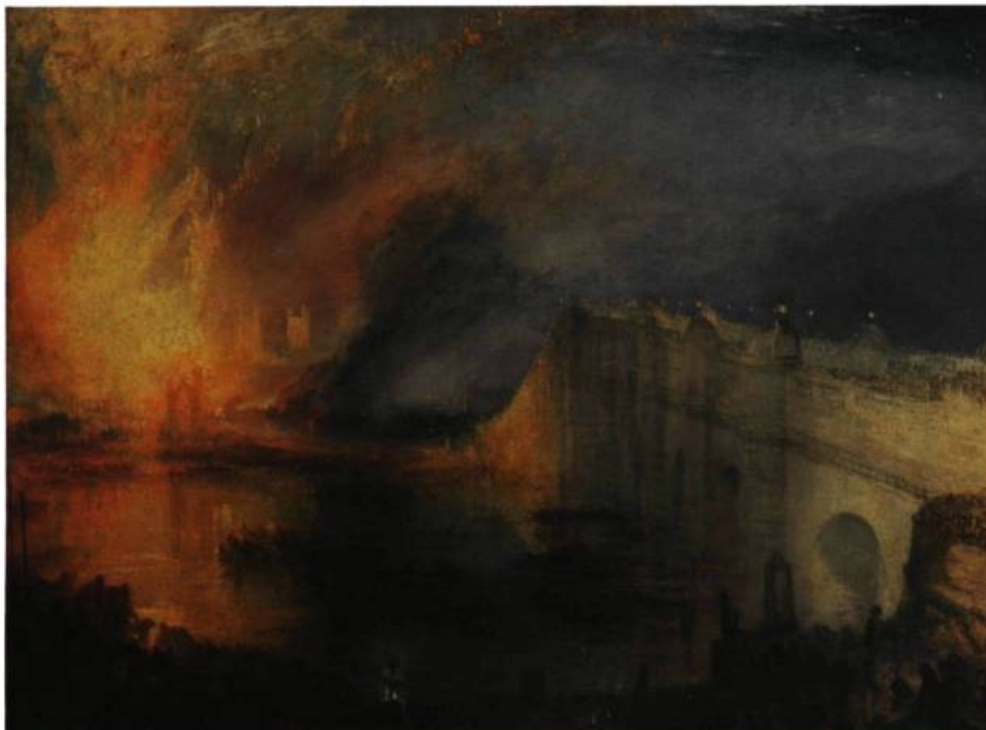
Joseph M. W. Turner The Burning of the House of Lords and Commons 1834 ou 1835 Huile sur toile 92 x 123 cm Philadelphia Museum of Art