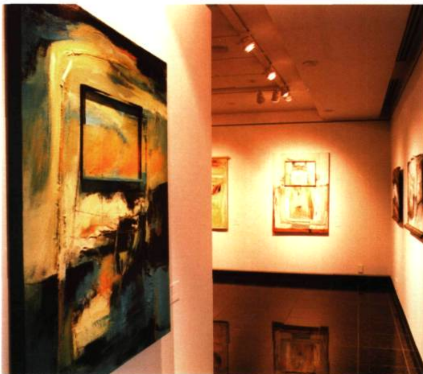
Monique Voyer