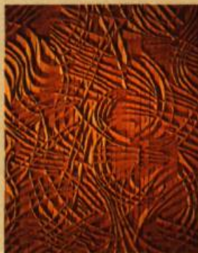
Mario Merola Relief ochre, 1990 Acrylique sur bois (tilleul) 75 x 55 cm

Les artistes suivants parmi d'autres ont accepté de faire don d'une de leurs œuvres à l'OMPAC: