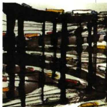
Yao Kui 3D, 1991 34 x 34 cm

Galerie Laliberté 7903, rue Saint-Denis Montréal (514) 387-2787