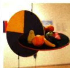
Sphères, atmosphère, biosphère, MAC 1999 Techniques mixtes

• Dans l'article intitulé L'art de l'école au musée du numéro précédent, la légende et le texte accompagnant cette œuvre aurait dû se lire comme suit: