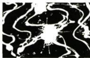
Noir de Carbone, 2000 Acrylique sur toile 108 x 163 cm Œuvre exposée à la Galerie Graff

«Ce que j'attends d'une peinture, c'est qu'elle vous fulgure... Son contenu, sa profondeur doivent vous posséder pour toujours!» Ces propos de Jacques Hurtubise s'appliquent parfaitement à sa peinture. Artiste dont l'œuvre gestuelle exprime la fougue et les stridences mais aussi la minutie et la précision, il est le lauréat, cette année, du Prix Paul-Émile-Borduas, la plus haute distinction accordée par le gouvernement du Québec dans le domaine des arts visuels. Sa production (peinture, estampe, collage) s'étend sur quelque quarante ans et se poursuit toujours avec autant de puissance comme en témoigne ses œuvres récentes regroupées sous le titre Étoiles variables exposition