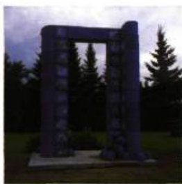
Alain-Marie Tremblay Hommage aux pionniers Arche de bétonique, 2000 1,80 x 2,10 x 3 m, vue générale