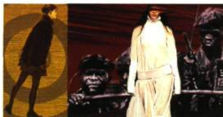
Model Walk (Zaire), 1999 huile sur toile, 333 x 180 cm