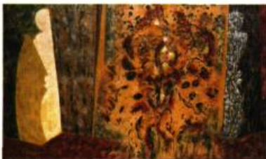
Amaryllis , 1996 Acrylique et collage sur toile 91,5 cm x 152 cm