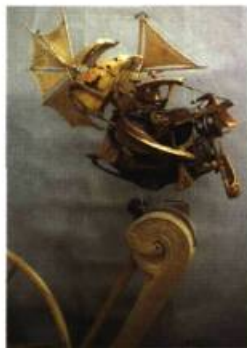
Réal Lauzon Le bathyscopaï Sculpture