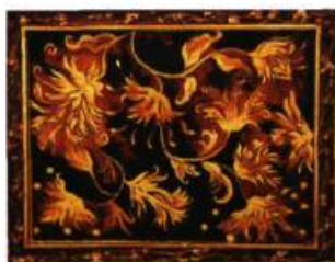
Betsabée Romero Paraisos paranoicos VI, 1998 Huile sur toile, 120 x 150cm

Le Conseil des arts du Canada a attribué neuf bourses reliées à l'avancement des métiers d'Art au Canada grâce aux fonds Jean-A-Chalmers. Les organismes ayant reçu les subventions sont: British Columbia Society of Tapestry Artists (Vancouver), Canadian Bookbinders and Book Artists Guild (Toronto), Le Conseil des Métiers d'Art du Québec (Montréal), Crafts Association of British Columbia (Vancouver), The Dundurn Group (Toronto), The Craft Studio at Harbourfront Centre (Toronto), The Nickle Arts Museum (Calgary), Nova Scotia Designer Crafts Council (Halifax) et Oakville Galleries (Oakville).