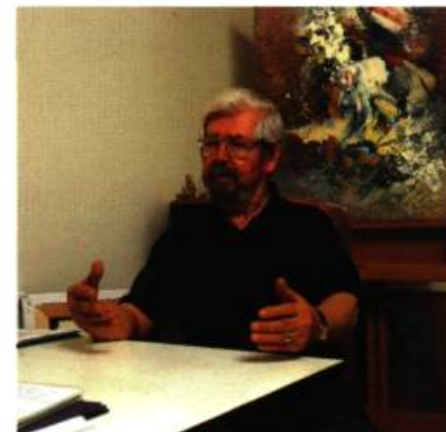
Certains poètes sont mes meilleurs amis. Je lis et je relis leurs œuvres.

L.B. : La vie, la joie de vivre m'inspirent naturellement. Quand je suis malheureux, je n'ai pas envie de peindre ; je ne peins pas. Quand je me sens triste, contrarié par des événements ennuyeux, je préfère simplement marcher dehors, dans la rue. Je cherche à me divertir ; je rends visite à des amis. Ce qui me stimulent ce sont les ouvrages des poètes du XIX e siècle et du XX e siècle et particulièrement ceux des surréalistes. Ils ne m'inspirent pas des images même si j'en vois en lisant. Ils ne m'influencent pas pour ma peinture.